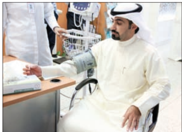
أحد موظفي «بيتك» يجري فحوصات طبية