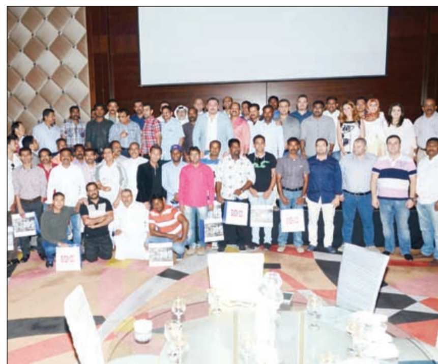
لقطة جماعية للعاملين في «همبل» خلال الاحتفال

عبر تزويد الدول المجاورة بمنتجات الشركة، مبينا ان العراق ولبنان والاردن من أبرز الدول المستوردة لمنتجات همبل ما يجعل مصنع الشركة بالكويت نقطة محورية لعدد من دول المنطقة، أما السعودية والامارات فليدها مصنعان، بالإضافة إلى مصنعين في البحرين وسورية.