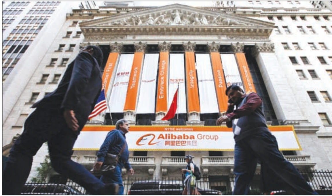
مناقشة شرسة بين شركة علي بابا وأمازون للحصول على مزيد من العملاء في الأسواق الأميركية

خدمات علي بابا من ناحية، وخدمات فوكس كون من جهة أخرى لخلق وإضافة الفرص الاستثمارية لعلينا».