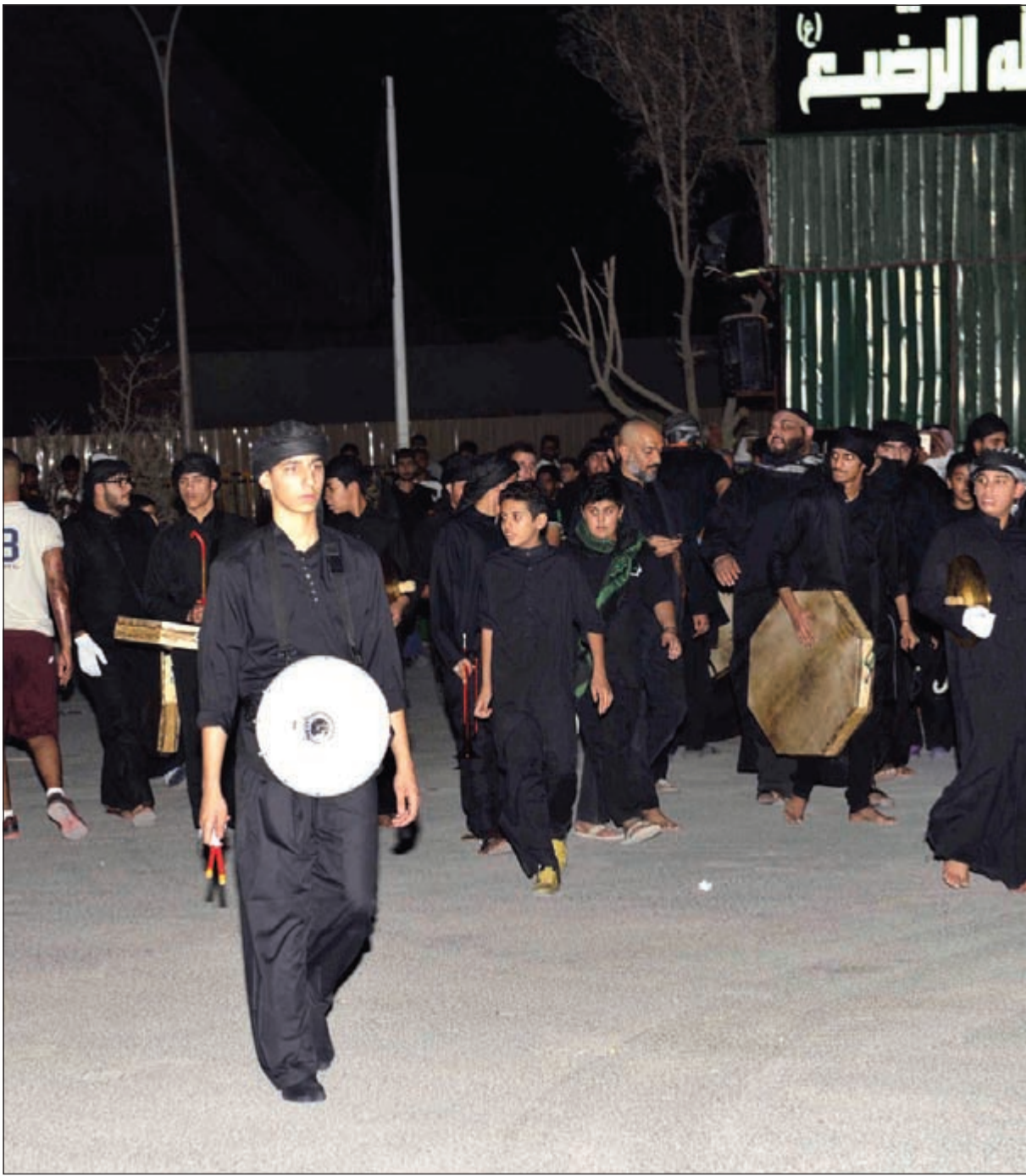
حضور كبير في أول أيام عاشوراء