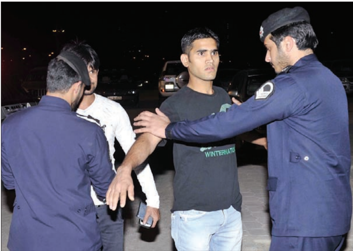
إجراءات أمنية مشددة