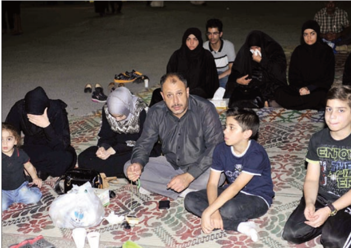
احدى الاسر ضمن الحضور