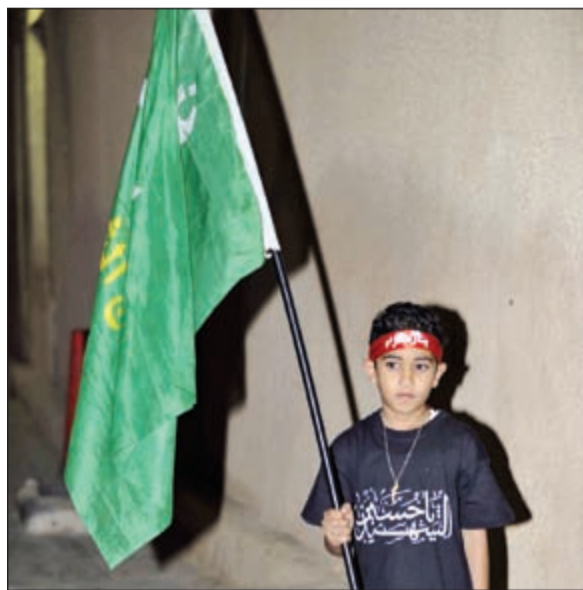
أحد الأطفال المشاركين

محمود الموسوي - عادل الشنان مع حلول شهر المحرم اتشحت الحسينيات بالسواد، في ذكرى استشهاد حفيد النبي الاكرم ﷺ الامام الحسين بن علي رضي الله عنهما واولاده واصحابه على رمضاء كربلاء في العام 61 هجري.. وفي هذا العام ومع ما تمر به المنطقة من احداث، توافد جمع كبير من ابناء الكويت والمقيمين الى تلك المجالس وسقط اجراءات أمنية مشددة من قبل وزارة الداخلية بالتعاون مع اللجان الأمنية من المتطوعين في الحسينيات، حيث التزم جميع الحضور بالتعليمات حفاظاً على سلامتهم.