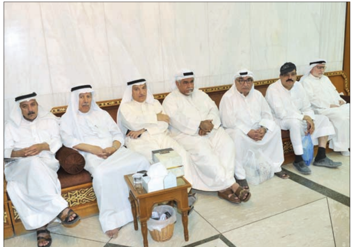
جانب من الحضور بالحسينية الجديدة