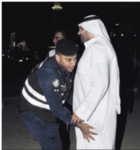
تفتيش قبل الدخول