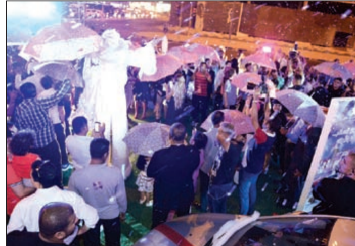
جمهور غفير من زوار «السلام مول» يتابعون إحدى الفقرات