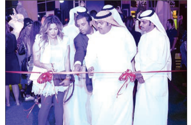
قص شريط افتتاح مهرجان «ثلجت بمجمع السلام»

يتجزأ من هذا العالم، فليس كل فرد منا لديه فرصة في تجربة الثلج، وفي إطار حرصنا على تقديم شيء مميز لعملائنا وخاصة الأطفال، أتحنا لهم المجال لعيشوا تجربة الثلج الممتعة. «ثلجت في مجمع السلام» بطابع الشتاء البريطاني مع عرض متمتع لفرقة عمالقة الثلج في المول. وكجزء من فعاليات مهرجان التسوق، ستكون هناك أربعة سحبيات مختلفة وستقام كل خميس، وجرى السحب الأول في 8 من أكتوبر الجاري.