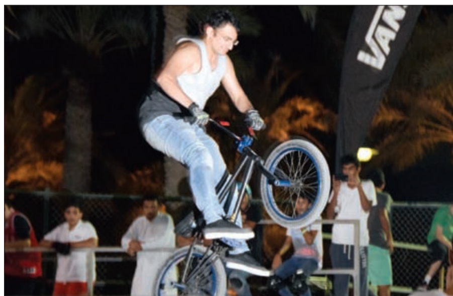
من منافسة السكوترز ودراجات «بي أم أكس» في حلبة التزلج في المارينا ويفز

جمعهم حب التحدي والمخاطرة، يستحقون منا كل الدعم والاهتمام، وما نحن اليوم ندعم مسيرتهم الرياضية من خلال تقديم جوائز لهم من «فانز» العلامة التجارية الرائدة حول العالم في معدات الأنشطة الرياضية، وإحدى العلامات الرياضية التابعة لنا في شركة علي عبدالوهاب المطوع التجارية. إن هذا الدعم هو خطوة تشجيعية هدفها الحث على الاستمرارية والتأكيد على أهمية احتضان هذه المواهب الرياضية المشرف للكويت، وإننا نتطلع إلى رؤية هؤلاء الهواة من الشباب في مصاف العالمية والحرفية في المجال الرياضي. وشملت المنافسة على التزلج في الهواء الطلق على «السكوترز» ودراجات «بي أم أكس» في حلبة التزلج في «المارينا ويفز» في السالمة، حيث استمرت من الساعة 6 حتى 9 من مساء الجمعة الماضي.