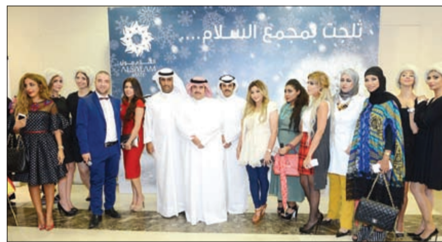
لقطة جماعية لعدد من الحضور في مهرجان «السلام مول»

يتجزأ من هذا العالم، فليس كل فرد منا لديه فرصة في تجربة الثلج، وفي إطار حرصنا على تقديم شيء مميز لعملائنا وخاصة الأطفال، أتحنا لهم المجال لعيشوا تجربة الثلج الممتعة. «ثلجت في مجمع السلام» بطابع الشتاء البريطاني مع عرض متمتع لفرقة عمالقة الثلج في المول. وكجزء من فعاليات مهرجان التسوق، ستكون هناك أربعة سحبيات مختلفة وستقام كل خميس، وجرى السحب الأول في 8 من أكتوبر الجاري.