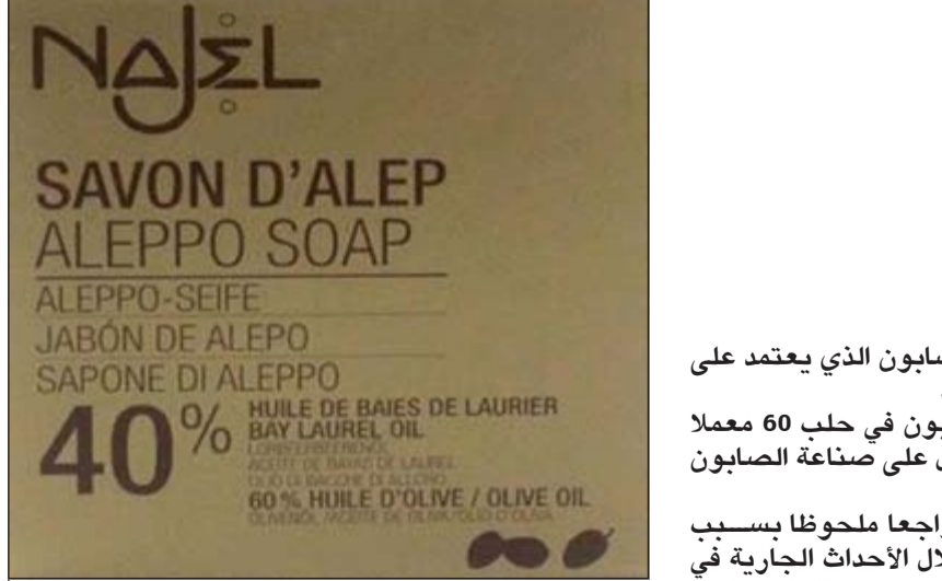
أحد أنواع صابون الغار الذي كان يستخدمه الفرنسيون المعروف بصابون حلب ويتكون من 40% من زيت الغار و60% زيت زيتون

لاقوه في أفغانستان»، مضيفاً «سيكسرون بإذن الله على عتبات الشام». وانتقد الجولاني البداية «المتعثرة» لضربات موسكو في سورية والتي استهدفت فصائل جيش الفتح والفصائل المتواجدة على تماس مباشر مع قوات النظام»، معتبراً أنها تترك أن «الإماكن التي تسيطر عليها جماعة الدولة (داعش)