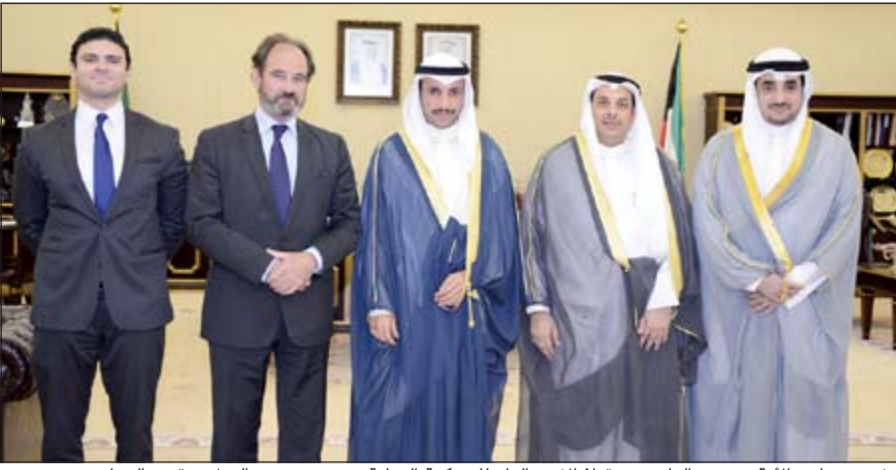
رئيس مجلس الأمة مرزوق الغانم مستقبلاً الأمين العام للمحكمة الدولية بحضور وزير العدل يعقوب الصانع

استقبل رئيس مجلس الأمة مرزوق الغانم في مكتبه أمس أمين عام المحكمة الدولية الدائمة للتحكيم في لاهاي هيغو سيبيلين. وحضر اللقاء وزير العدل ووزير الأوقاف والشؤون الإسلامية يعقوب الصانع، ورئيس اللجنة المالية للمحكمة الدولية المستشار طارق الشميمري.