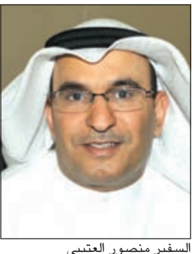
السفير منصور العتيبي

نيويورك - كونا: أكد مندوبنا الدائم لدى الأمم المتحدة السيد منصور العتيبي أهمية تسليط الضوء على الأقلية المسلمة المضطهدة في جمهورية أفريقيا الوسطى وما يتعرضون له من انتهاكات». وقال العتيبي لـ «كونا» بعد ترؤسه اجتماعاً للمندوبين الدائمين للسلول الأعضاء في منظمة التعاون الإسلامي حول الأوضاع في جمهورية أفريقيا الوسطى بصفته رئيساً للمجموعة الإسلامية في نيويورك أن المشاركين بالاجتماع ناقشوا التطورات الأخيرة في المنطقة وأهمها أعمال العنف التي يتعرض لها المسلمون في جمهورية أفريقيا الوسطى من قبل ميليشيات «آنتي بالكا». وأضاف أن الهدف من الاجتماع كان مناقشة استراتيجية التحرك من خلال السلول الأعضاء في المجلس الإسلامي لتسليط الضوء