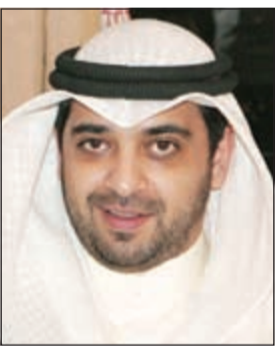
الشيخ محمد العبدالله

أطلق وزير الدولة لشؤون مجلس الوزراء الشيخ محمد العبدالله تطبيقاً على الأجهزة الذكية (الأيفون والأندرويد) يحمل اسم «نيوكويت» يهدف إلى تعريف المجتمع بأخر ما توصلت إليه المشاريع الحكومية. وقال الشيخ محمد العبدالله لـ «كونا» أمس إن تطبيق «نيوكويت» يمثل نقلة نوعية في التعاطي