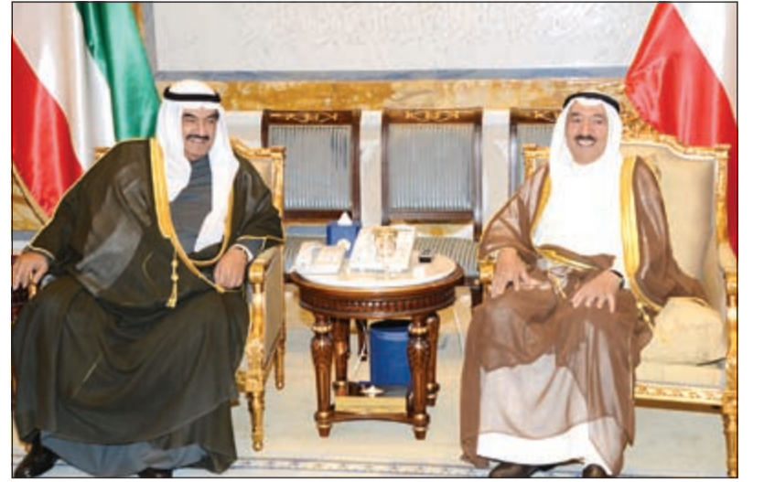
صاحب السمو الأمير الشيخ صباح الأحمد خلال استقباله سمو الشيخ ناصر المحمد

صاحب السمو التقى ولي العهد والمحمد والمبارك والسفير السويسري