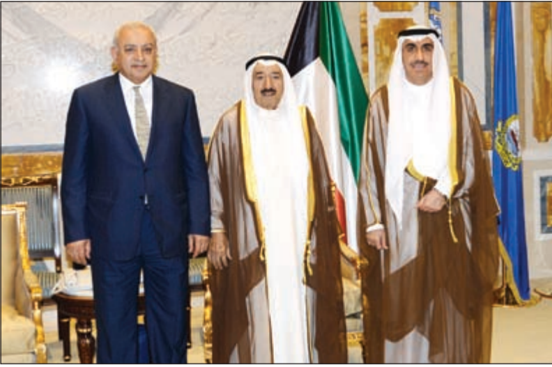
صاحب السمو الأمير مستقبلاً د. بدر العيسى ود. حسين الأنصاري