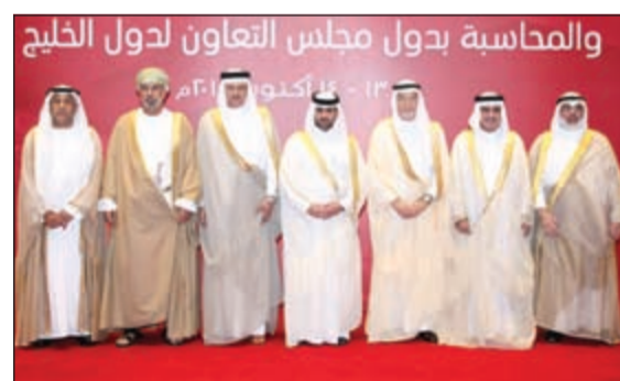
رؤساء الدواوين الخليجية في صورة جماعية

المهنية الأساسية المتعلقة باستراتيجية التدريب وإعداد البحوث والدراسات وتعزيز أنشطة البحث العلمي، بالإضافة إلى مشروع الرقابة الشاملة المشتركة. وأشار إلى أن دول الخليج تشر حالياً بفترة استثنائية تتزامن خلالها تداعيات الأسعار العالمية للنفط مع وجود خطط ومشاريع تنموية طموحة لدى هذه الدول، الأمر الذي تترتب عليه ضغوط إضافية على الدول للمضي قدماً في برامجها التنموية دون أن تتأثر بالتغيرات الاقتصادية، ما يستدعي أن يكون العمل الرقابي بالتعاون خلال العام 2015، ويكتسب أهميته لتناوله عدداً من القضايا