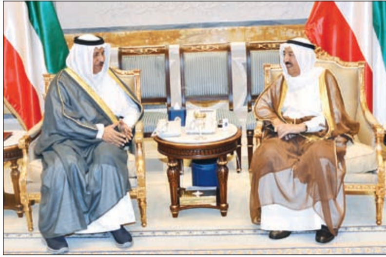
صاحب السمو الأمير الشيخ صباح الأحمد مستقبلاً سمو رئيس الوزراء الشيخ جابر المبارك