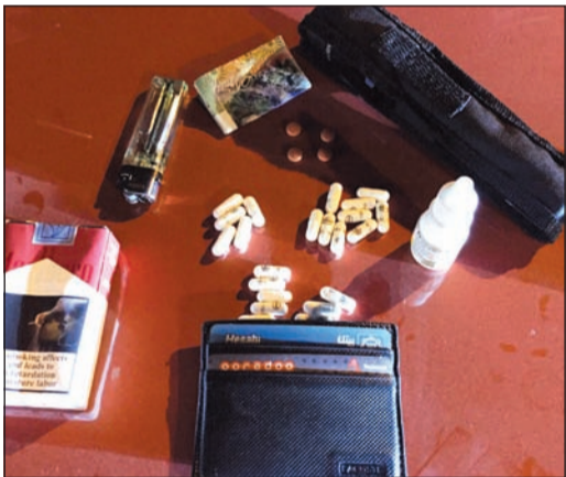
المضبوطات من المواد المخدرة