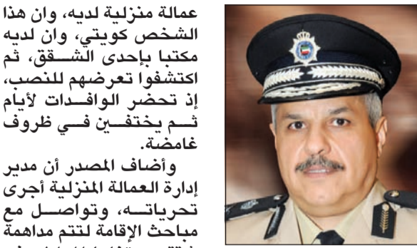
اللواء الشيخ مازن الجراح

وأضاف المصدر أن مدير إدارة العمالة المنزلية أجرى تحرياته، وتواصل مع مباحث الإقامة لتتعمق مدهامة شقة يستغلها المواطن في