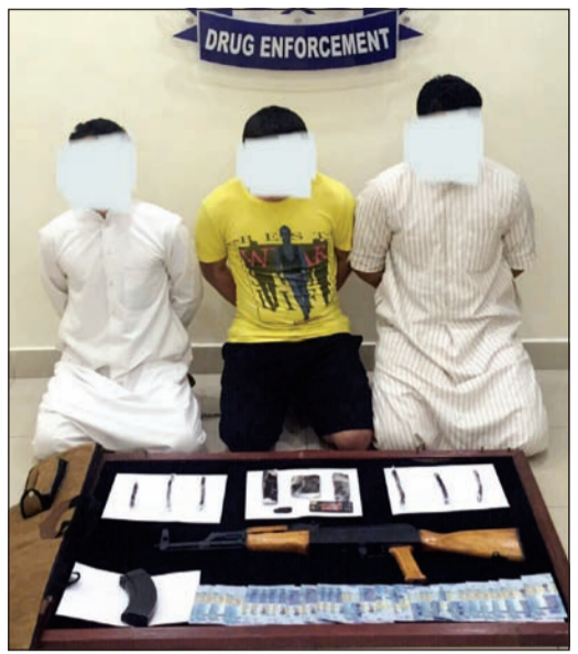
التشكيل العصابي الثلاثي قبل إحالة إلى النيابة العامة