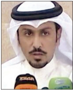
المحامي دخال الكيفية

وأسندت النيابة العامة للمتهم الثاني (م.خ.) أنه قام بتدريب أعضاء التنظيم على استخدام الأسلحة وهو يعلم أنه يدرهم للقيام بأعمال مناهضة لنظام الدولة ويسعى إلى تقويض أركان الدولة. كما أسندت للمتهمين جميعا (ط.ف.) و(م.خ.) و(ع.ع.) و(خ.س.) و(م.م.) و(ع.ع.) و(س.ح.) تهمة تمويل الإرهاب.