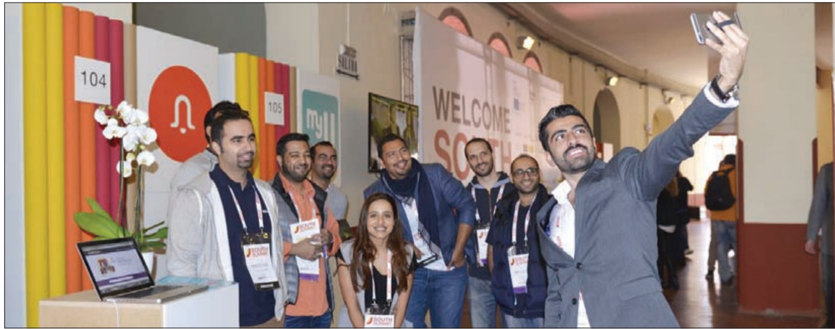
«سيليغي» للمباردين المشاركين بمشاريع ناشئة من الكويت