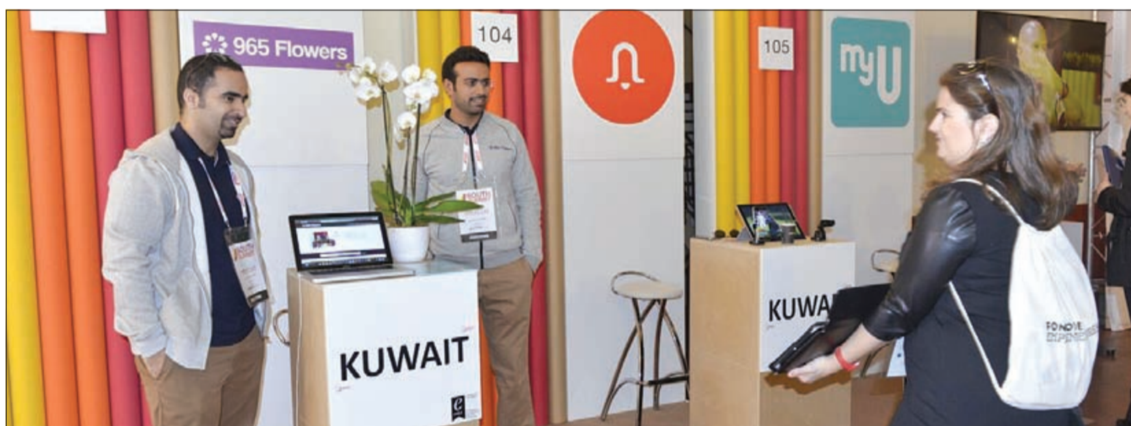
جانب من جناح «بريلنت لاب» في المؤتمر