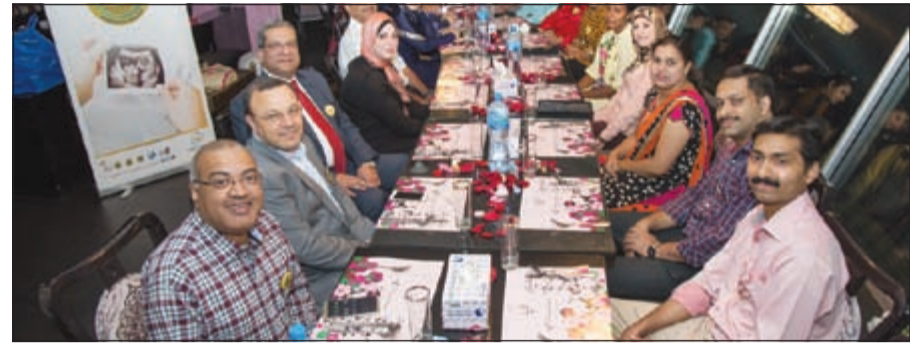
جانب من الحفل التكريمي لموظفي «دار الشفاء»

عقد مستشفى دار الشفاء حفلاً تكريمياً احتفاءً بحصوله على شهادة الاعتماد الذهبي للكلية الأميركية للأشعة (ACR)، لفترة ثلاث سنوات فوق الصوتية، وذلك بعد حصوله على شهادتي الاعتماد الذهبي للكلية الأميركية للأشعة (ACR)، لفترة ثلاث سنوات للتصوير بالرنين المغناطيسي (MRI) في عام 2014، والتصوير المقطعي (CT) للكبار والأطفال في عام 2013. ومن خلال هذا الاعتماد الذي يمثل أعلى مستوى من جودة الصورة وسلامة المرضى وعبر نجاح قدرات مركز التصوير التشخيصي في المستشفى، يتطلع مستشفى دار الشفاء إلى مواصلة تطبيق