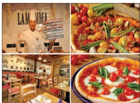
أشهى أنواع البيززا المخبوزة على الحطب في «شيراتون الكويت»

من جنوب إيطاليا والذي ينتظركم في الدور الثاني من فندق فوربونتس شيراتون الكويت ليضع سنوات خبرته الطويلة في تحضير البيززا والباستا في أذ أطباقكم. وتتميز «بيتزيريا لاماما» بإطلالة مميزة على بوابة الجواهر التاريخية أما التصميم الداخلي فيتميز بالبساطة والرواق حيث يرتكز على مزيج من الخشب والألوان العصرية مقدماً بذلك تجربة استثنائية ورائعة لسرواده، فسواء كنتم في زيارة عمل أو للمرح تنتظركم بيتزيريا لاماما لتذوق الأذ الأصناف والاستمتاع بتجارب طعم استثنائية حيث في بيتزيريا لاماما أجواء الريف الإيطالي في قلب الكويت.