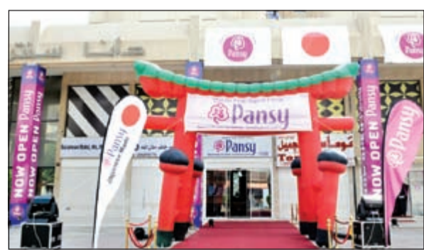
فرع «بانسي» في مجمع دانا سنتر بمنطقة السالمية

ويعد افتتاح الفرع الأول بمجمع دانا سنتر بمنطقة السالمية في خطوة التوسع والانتشار التي وضعتها شركة الكخبان الكويتية الوكيل الحصري لأحذية بانسي في الكويت والتي سينبعا خطوات أخرى أكبر لتشمل السوق الكويتي وجميع أرجائه، حيث تعول إدارة الشركة على أهمية السوق الكويتي المحلي كخطوة أولى للتوسع في السوق الإقليمية، وبهذا الافتتاح المميز تكون قد وضعت أولى خطواتها في طريق النجاح.