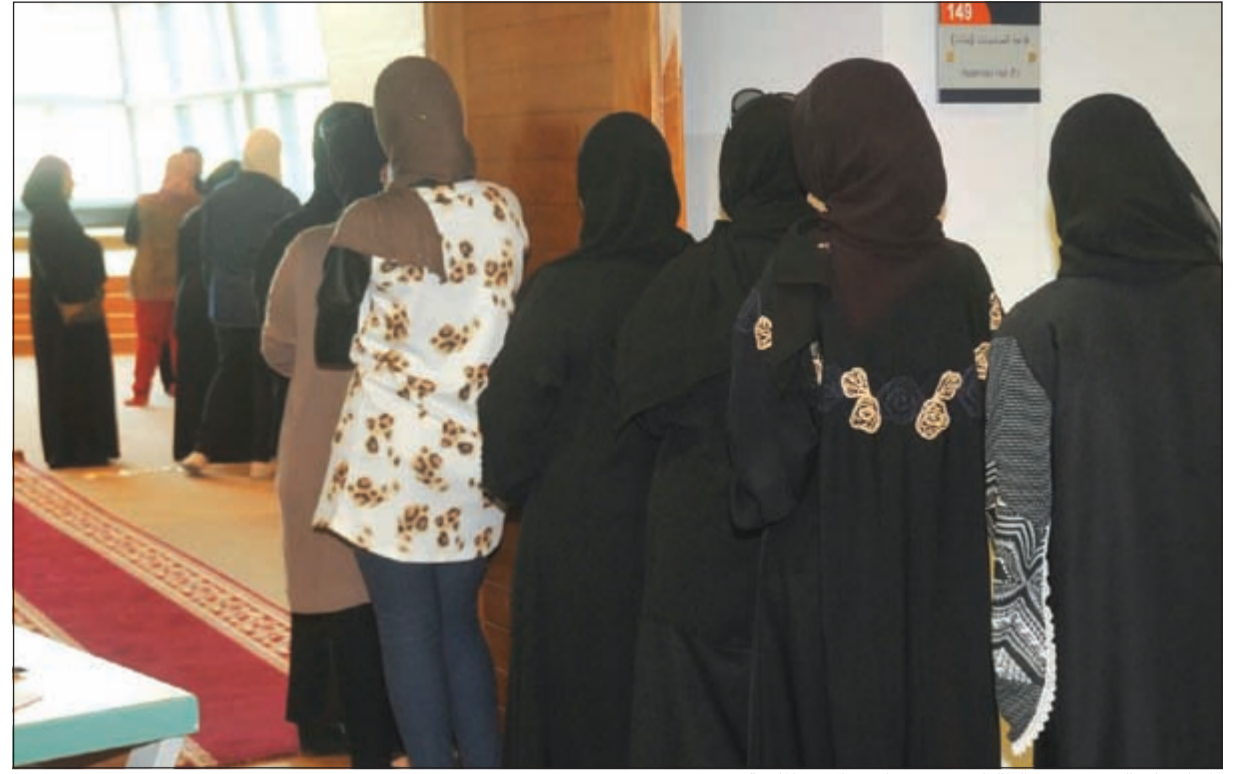
إقبال على التصويت من الطالبات في معهد الاتصالات والملاحة