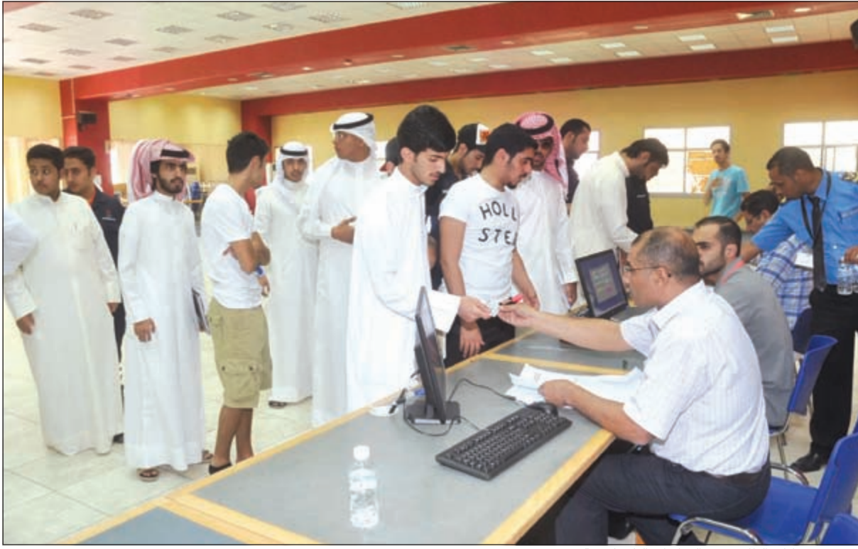
تدقيق في بيانات الطلاب في «الدراسات التكنولوجية»