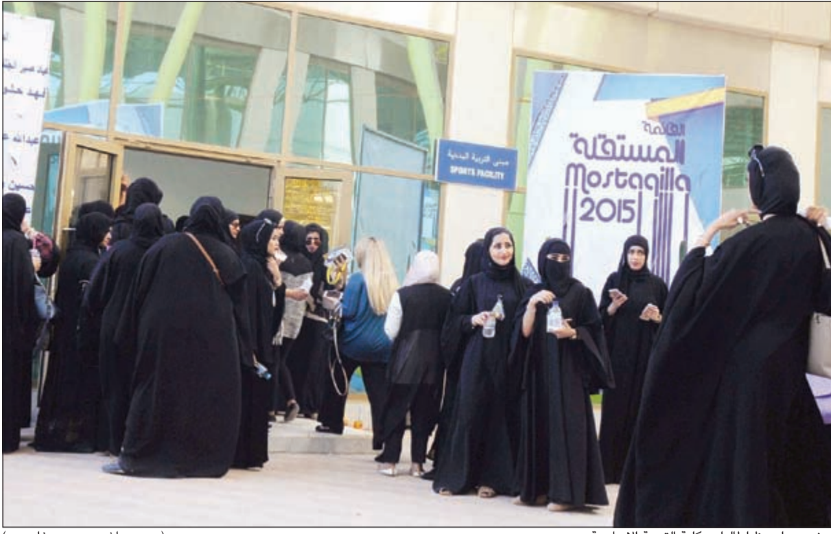
حضور ملحوظ لطالبات كلية التربية الأساسية