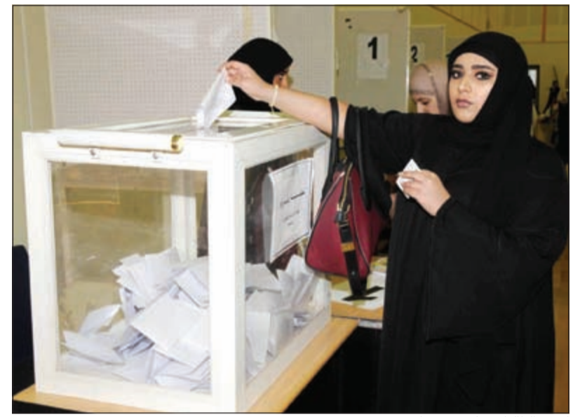
إحدى الطالبات تدلي بصوتها

نظام التصويت. وفي كلية التربية الأساسية - بين تواجد عدد من رجال الشرطة لتنظيم حركة السير كما كان هناك عدد آخر من الشرطة بالقرب من لجنة الطلبة يراقبون الوضع