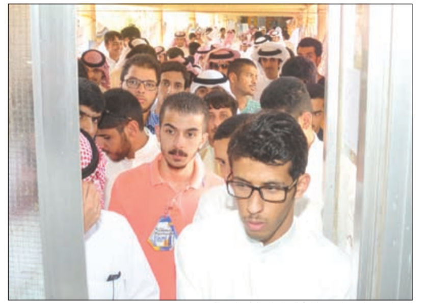
ازدحام قبل الاقتراع في كلية الدراسات التكنولوجية