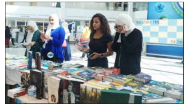
إحدى دور النشر المشاركة في معرض الكتاب

أقام النادي الإنجليزي بجامعة الخليج للعلوم والتكنولوجيا معرضاً للكتاب في الحرم الجامعي بمشرف على مدار يومي الأحد والاثنين الماضيين، شاركت فيه بعض دور النشر وعرض فيه مجموعة من الكتب التي تهتم الطالب الجامعي وبأسعار في متناول الجميع.