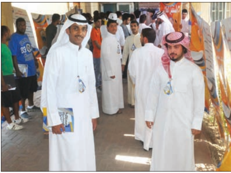
طلاب كلية الدراسات التكنولوجية يستعدون للاقتراع صباحاً