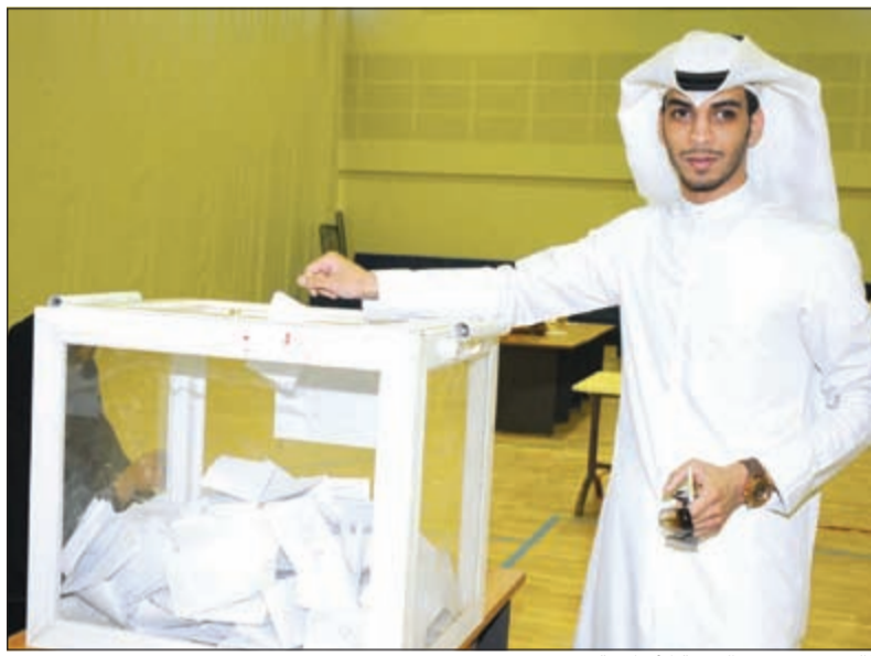
طالب يقترع في «التربية الأساسية»