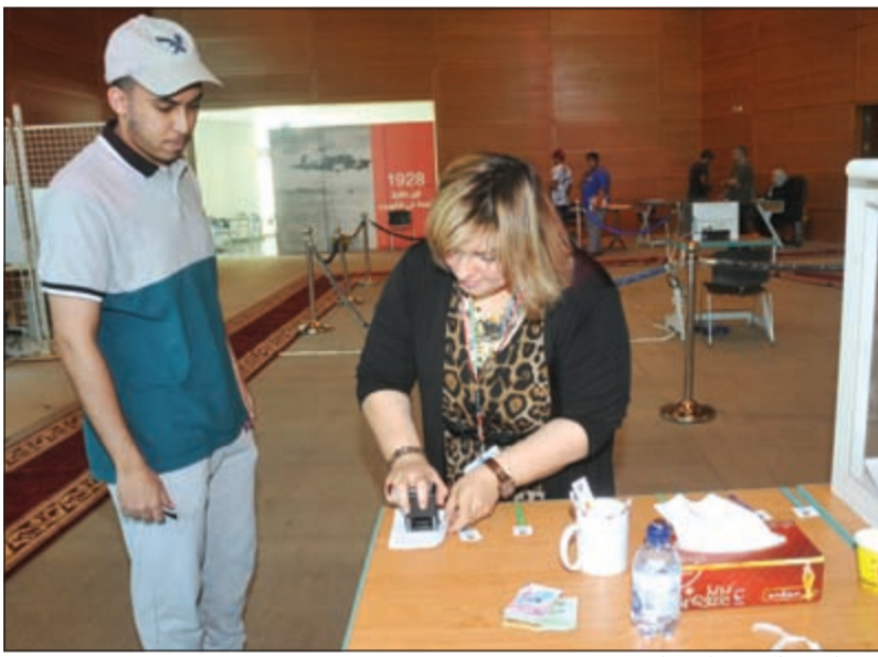
ختم الاستمارة قبل الاقتراع