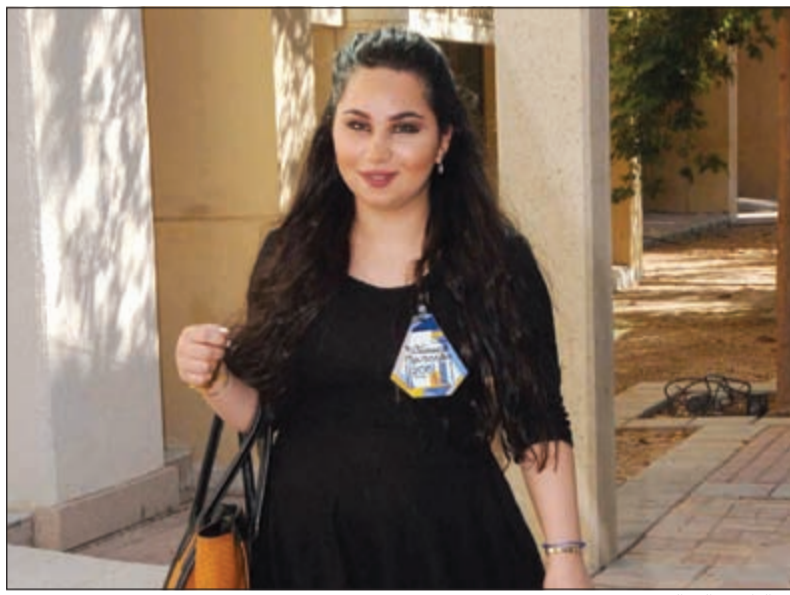
في الطريق إلى التصويت