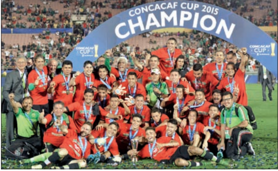
منتخب المكسيك إلى روسيا

ولحقت المكسيك في كأس القارات المقررة من 17 يونيو إلى 2 يوليو 2017 بمنتهيات روسيا المضيفة والمانيا بطة العالم عام 2014 وتشيلي بطة كوبا أميركا 2015 واستراليا بطة آسيا 2015 التي ضمنّت المشاركة حتى الآن. وتشكل النتيجة خيبة أمل كبيرة لمنتخب الولايات المتحدة ومدرّب الألماني يورغن كلينسمان الذي كان استدعى عناصر الخبرة لضمان التأهل إلى كأس القارات. واستدعى كلينسمان 16 لاعبا من المنتخب الذي خاض غمار نهائيات كأس العالم في البرازيل صيف 2014 وتأهل إلى الدور الثاني قبل أن يخسر أمام نظيره البلجيكي 2-1 بعد التمديد. وكان المنتخب الأميركي حل رابعا في كأس الذهبية على أرضه في يوليو الماضي، بعد أن كان فقد لقبه بخسارته أمام جامايكا 2-1 في نصف النهائي، كما تعرض إلى خسارة ثقيلة 4-1 أمام نظيره البرازيلي مطلع الشهر الماضي.