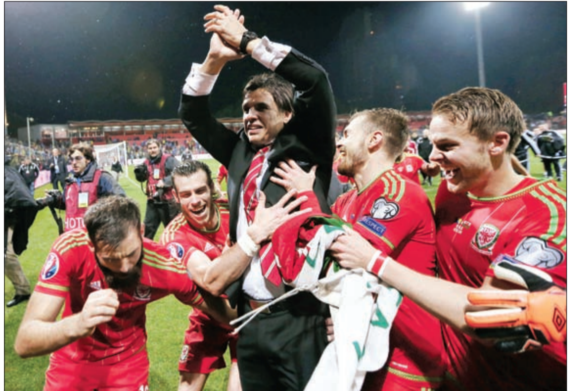
أخيرا تأهلت ويلز (رويترز)

أسدت قبرص خدمة إلى ويلز بفوزها على مضيفتها اسرنايل 2-1 أيضا. وتأهل حتى الآن 11 منتخبا من أصل 24 هي إضافة إلى بلجيكا وويلز، إيطاليا وإسبانيا حاملة اللقب وفرنسا المضيفة وانجلترا وتشيكيا وإسبانيا والنمسا وإيرلندا الشمالية والبرتغال وسويسرا.