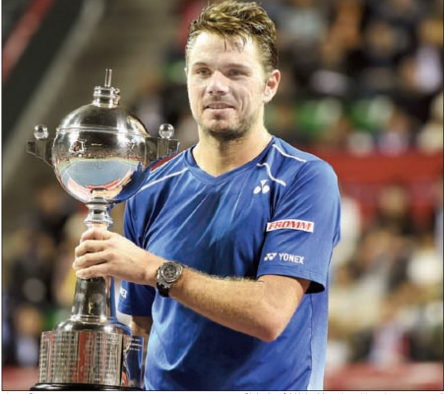
السويسري ستانيسلاس فافرينكا حاملا كأس البطولة (أ.ق.ب)

خلال المباراة خوفا من هطول الأمطار. وسيطر فافرينكا على اللعب طوال المباراة كما تظهر النتيجة وحسم المجموعة الأولى في 26 دقيقة فقط بعد أن كسر إرسال صديقه الفرنسي ثلاث مرات. في المجموعة الثانية واجه فافرينكا بطل استراليا المفتوحة في 2014 بعض المقاومة لكنه سرعان ما حسم اللقب بعد أن كسر إرسال بير في الشوط العاشر. ورغم أن بير غير المصنف فجر مفاجأة كبيرة في قبل النهائي عندما هزم حامل اللقب الياباني كي نيشيكوري، إلا أنه فشل تماما في التصدي لفافرينكا. وخاض بير المباراة النهائية برباط حول كاحله الأيسر.