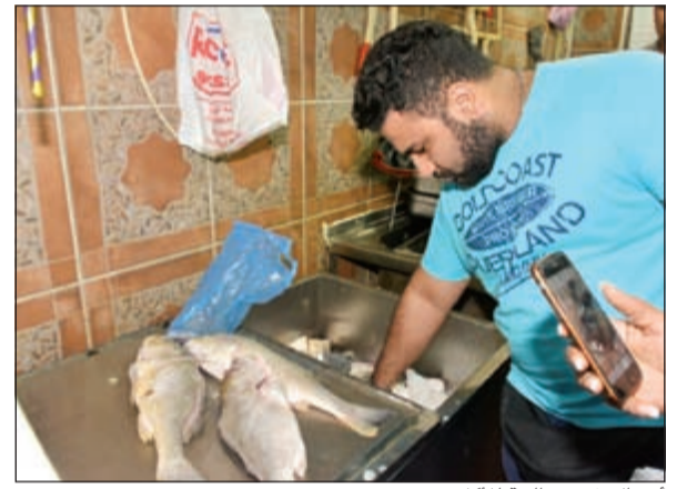
أسماك غير صالحة للأكل