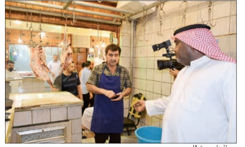
جولة على سوق اللحوم

4,5 دنانير سعر صندوق طماطم والخط 135 مستعد لتلقي الشكاوى طوال اليوم