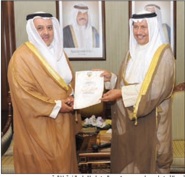
أحد الأعضاء يسلم سمو رئيس الوزراء إقرار الذمة المالية