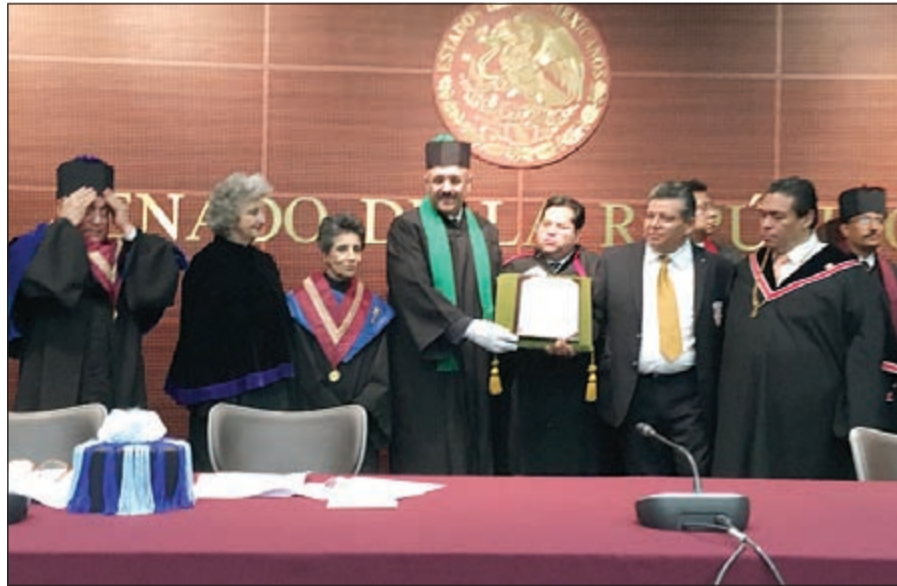
السفير سميج جوهر حيات خلال منحه شهادة الدكتوراه الفخرية من جامعة المكسيك الدولية الحكومية

وأوضحت السفارة أن هذا التكريم يندرج ضمن تكريم حكومي وأكاديمي يحصل عليه السفير حيات من مؤسسات تعليمية رفيعة المستوى منذ توليه منصبه في المكسيك عام 2011 حيث سبق له أن حصل على درجة الدكتوراه الفخرية في القانون من جامعة «البيديغال» المرموقة وعلى ميدالية الحقوق العليا الذهبية من الجامعة الوطنية الحكومية المستقلة في ولاية «موريلوس». ولفتت السفارة إلى أن السفير حيات حصل أيضاً على أعلى وسام من مؤسسة الشرف العالمية «لجيت أوف أونير» وعلى درجة الأستاذية الفخرية من كلية الحقوق في الدراسات العليا في جامعة المكسيك الحكومية المستقلة «أونام». ووفقاً للسفارة نال السفير حيات أيضاً شهادة الدكتوراه من كلية الحقوق والقانون في جامعة «موريلوس» المستقلة الحكومية الوطنية والقلادة الذهبية العظمى في مجال الإصلاح من الأكاديمية الوطنية المكسيكية الحكومية ووسام الاستحقاق والتميز بدرجة الشارة العظمى.