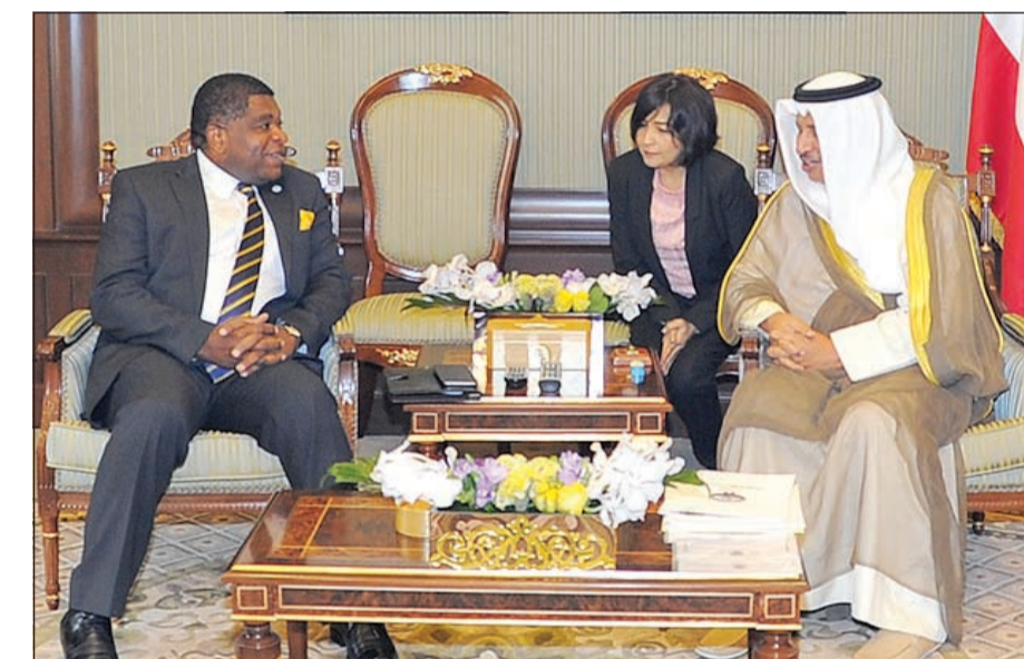
سمو رئيس الوزراء الشيخ جابر المبارك مستقبلاً أمين عام الاتحاد البرلماني الدولي

الوزراء الشيخ خالد محمد الخالد، ووصف رئيس الهيئة العامة لمكافحة الفساد المستشار عبدالرحمن النمش بتقديم سمو الشيخ جابر المبارك رئيس مجلس الوزراء إقرار ذمته المالية بأنه «حدث فريد على المستوى الإقليمي والوطني»، مؤكداً حرص سموه على الالتزام بالقانون. وقال المستشار النمش في تصريح لـ «كونا» أمس عقب لقائه مع سمو رئيس مجلس الوزراء أن تلك المبادرة تعد السابفة الأولى التي يقدم فيها رئيس وزراء في دولة الكويت ودول مجلس التعاون الخليجي وأغلب دول المنطقة إقرار الذمة المالية. وأضاف أن تلك المبادرة تمثل رسالة واضحة لكل