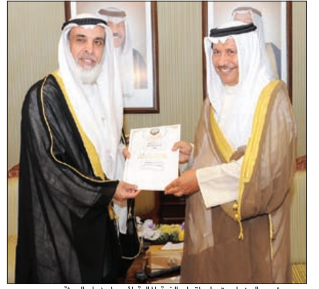
سمو رئيس الوزراء يتسلم إقرار الذمة المالية لأحد أعضاء الهيئة

سموه دعا جميع القياديين في الدولة إلى الإسراع بتقديم إقرار الذمة المالية الخاصة بكل منهم تنفيذاً للقانون