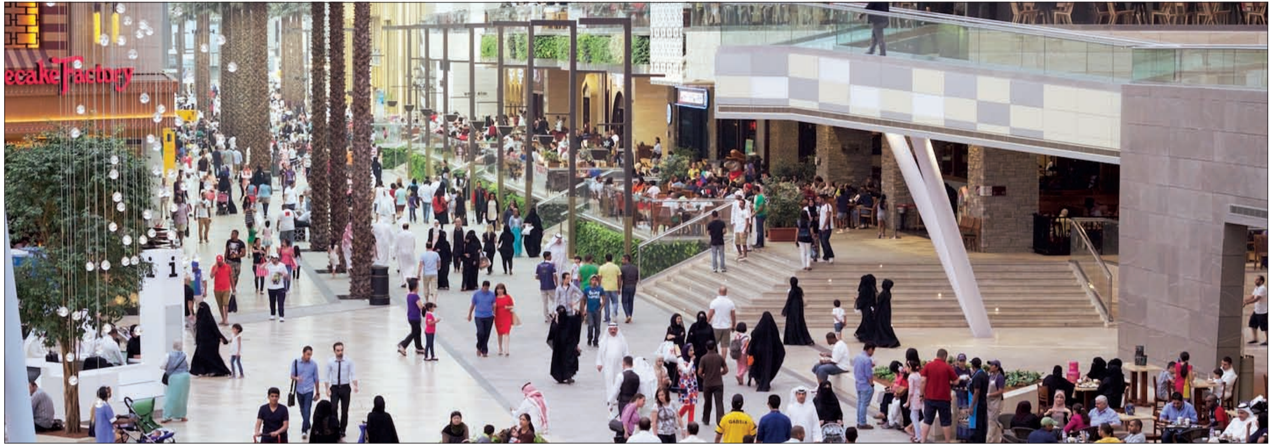
الطلب الكبير على وحدات التجزئة والمحلات التجارية بالمجمعات أدى إلى ارتفاع معدلات التأجير بها خلال السنوات الخمس الأخيرة.. الصورة تظهر الطلب الكبير على المساحات التجارية في مول الأفتيونز

25 ديناراً للمتر متوسط معدل التأجير بالدور الأرضي في المجمعات التجارية