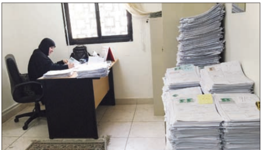
المعاملات مكسدة على المكاتب

وأشار أحد المناديب إلى خلل متكرر في برنامج الميكنة يؤثر سلبا أحيانا على العمل، الأمر الذي يزعج الموظف وال مندوب أو صاحب العمل، كما أن المكان ضيق والمكاتب ضيقة والمعاملات تصف على طاولات الموظفين نظرا لضيق المكان، والملفات كذلك تخزن في مكان ضيق في تلك المكاتب، وهذا ما يربك العمل أحيانا.