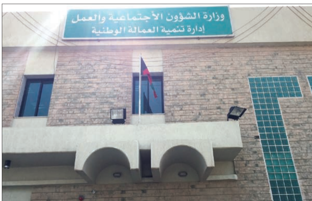
إدارة تنمية العمالة الوطنية

تطبيق توصيات التنمية وحماية العمالة الوطنية مع إدارات العمل في المحافظات