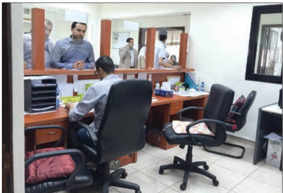
أحد الموظفين يؤدي عمله