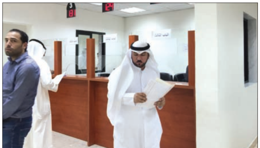
مراجعون لإدارة تنمية العمالة الوطنية