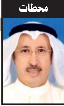
سامي عبد اللطيف النصف

مثلاً علاقة المقاول الرئيسي مع مقاول الباطن علاقة متبوع (المقاول الرئيسي) مع تابع (مقاول الباطن) فإذا أحدث التابع ضرراً بالغير وجب على المتبوع تعويض الغير والرجوع الي التابع بما دفعه عنه إذا لم يوجد نص بالعقد بين الطرفين يحدد الالتزامات هذه بشكل آخر. إذا تعاقد أحد مع مالك كويتي للقيام بأعمال معينة في عقاره وتجاوزت قيمة العقد الألف دينار وحصل أثناء أو بعد الانتهاء من العمل نزاع قضائي فقد تلجا المحكمة لرفض الدعوى للوافد المدعي لأنه خالف قانون التجارة عندها يجب على الوافد رفع دعوى إثراء بلا سبب لأنه عمل للمالك خدمات لم يتقاضى ثمنها بموجب الاتفاق وعليه يجب إثبات حقه. (المصدر سلسلة الوعي القانوني للتأكد من المعلومات).