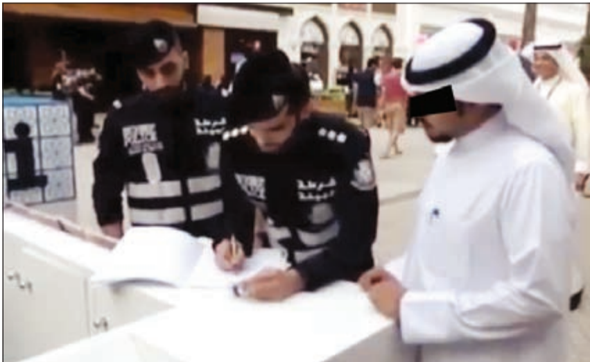
توقيع مواطن على تعهد في إطار حملة توعية استعدادا لتطبيق قانون البيئة

بِقانون البيئة خاصة في الأماكن العامة وبالأخص مخالفات التدخين والتي تصل عقوبتها حسب القانون إلى غرامة 100 دينار وبالنسبة لإلقاء المخلفات في غير الأماكن المخصصة لها وغرامتها 500 دينار. وقال اللواء العلي في تصريح خاص لـ «الانباء» أن