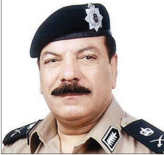
اللواء عبدالفتاح العلي