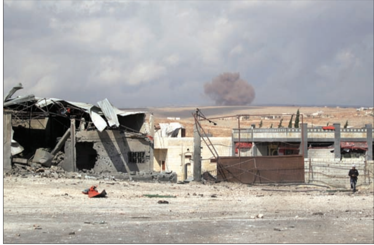
الدخان يتصاعد من موقع الغارات التي يقول ناشطون ان طائرات روسية نفذتها في ريف ادلب

ورد بوتين بأن من السابق لأوانه الحديث عن نتائج