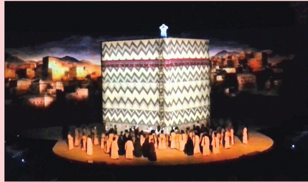
جانب من أوبريت «عناقيد الضياء»