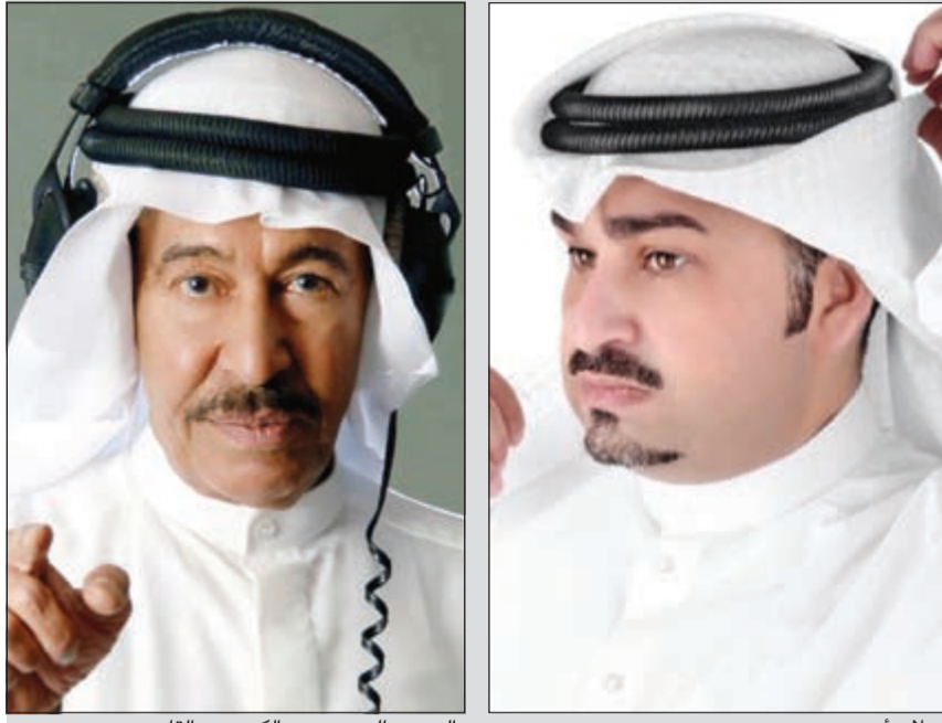
«الصوت الجريح» عبدالكريم عبدالقادر