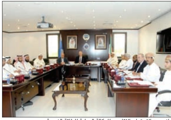
جانب من الاجتماع الاقليمي للوكالة الدولية للطاقة النووية