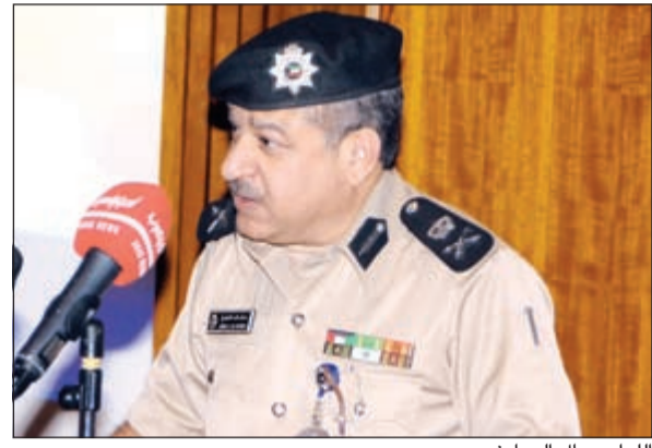
الواء جمال الصايغ