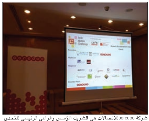
شركة ooredoo للاتصالات هي الشريك المؤسس والراعي الرئيسي للتحدي