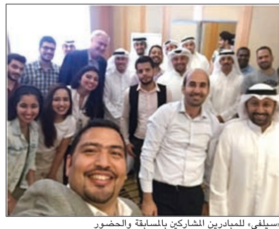
سيليقي، للمبادرين المشاركين بالمسابقة والحضور