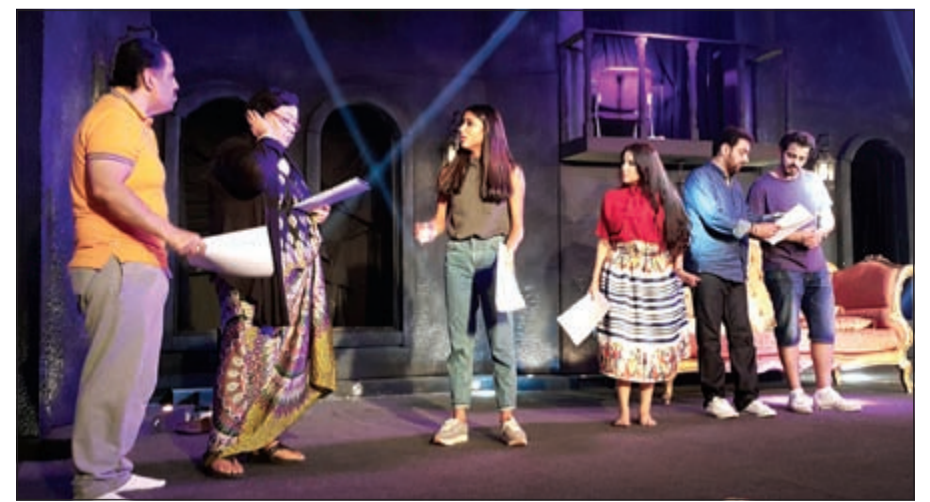
مشهد من مسرحية «صرخة الأشباح»