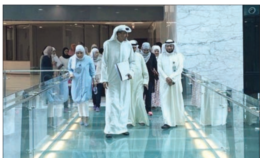
عبد الله صاoud

قام مدير عام الهيئة العامة لشؤون القصر براك الشبتان وقبايدو الهيئة بجولة تفقدية لمبنى الهيئة الجديد في منطقة المرقاب، وذلك عصر يوم الخميس واستمرت الجولة للاطلاع على الإنجازات الخاصة بالمبنى، توقف خلالها على آخر الترتيبات والتجهيزات المنجزة للمبنى الجديد، حيث تم استكمال جميع الأعمال في المشروع الذي بلغت تكلفته الإجمالية 21 مليون دينار وبمساحة أرض كلية تصل إلى 10555 مترا مربعا. وأوضحت مصادر مطلعة في الهيئة لـ «الأنباء» ان الافتتاح الرسمي للمقر الرئيسي الجديد سيكون خلال الأشهر المقبلة المقبلة بعد ان يتم تأثيث كل المرافق الداخلية للمبنى وتجهيز المكاتب الخاصة بموظفي الهيئة وهو مصمم وفقا لأحدث التصاميم المعمارية وملبيا للاحتياجات والمتطلبات المساحية لدى المستخدمين من إداريي وموظفي الهيئة والتسهيل على مرارعي الهيئة من القصر والمشمولين برعاية الهيئة، وذلك لتسهيل حركة المعاملات اليومية واستيعاب أكبر عدد من وافي المبنى الذكي الجديد.