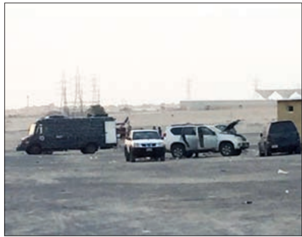
رجال المتفجرات خلال تعاملهم مع المركبة

استعان رجال ادارة المتفجرات يوم امس بالربوت للتعامل مع مركبة مشتبته بها كانت متوقفة مقابل مسجد صفيح، وتبين خلو المركبة من أي مواد متفجرة. وكانت عمليات الداخلية قد تلقت بلاغا بوجود مركبة مهملة منذ 3 أيام الى جوار المسجد لتتم الاستعانة بادارة المتفجرات والتأكد من خلو المركبة، وتبين ان المركبة تعود لأسرة خليجية وتم تسجيل اثبات حالة.