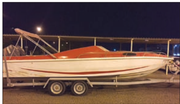
الطراد الذي تمت إعادته