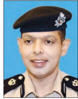
العميد عادل الحشاش

نسعى جاهدين لتحقيقه حفاظا على سلامة السائقين وجميع مستخدمي الطريق. وأضاف اللواء المهنا أن كل مواطن يقود مركبة تحمل لوحات خليجية أمامه مهلة شهر يتم خلالها استبدال اللوحات، مشيرا الى ان ارتكاب مخالفات مرورية جسيمة أو بسيطة يشكل اسياءة بالغة للسائق وللجهة التي صدرت عنها تلك اللوحات، وهو ما لا نقبله ولن نسرح به على الإطلاق، مبرعا عن أمه ان يتحمل كل مواطن لديه مركبة تحمل لوحات خليجية المسؤولية الانبئية والأخلاقية في عدم اسياءة استخدام هذه اللوحات في ارتكاب مخالفات مرورية تشكل خطرا داهما عليه وعلى كل مستخدم الطريق، لافتا الى أن رجال أجهزة الإدارة العامة للمرور لن تتهاون