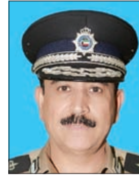
اللواء عبدالله المهنا