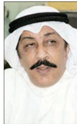
اللواء عبدالحميد العوضي