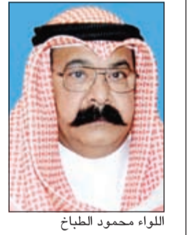
اللواء محمود الطباخ

لم تكد ساعات تمر على تمكن رجال الإدارة العامة للمباحث الجنائية ممثلة في إدارة جرائم المال من ضبط أحد أكبر المزيورين على مستوى الشرق الأوسط وغلقهم لما يمكن وصفه بمجمع الوزارات المزور، حتى تمكن رجال إدارة بحث وتحري محافظة مبارك الكبير من ضبط مواطن يبلغ من العمر 25 عاما ورغم حداثة عمر المتهم الا ان سجله حافل بقضايا النصب والاحتيال والتزوير، وقدرت القضايا المطلوب على نذمتها بـ 20 قضية متنوعة، كما تبين انه