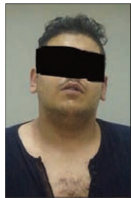
المتهم سالب الوافدين في حولي