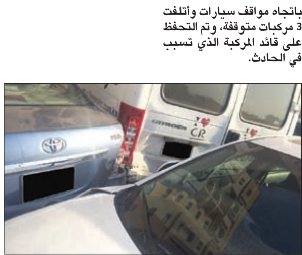
من حادث شارع الخطابي

ألقي رجال أمن خلال حملاتهم يوم أمس الأول القبض على مواطن في منطقة العديلية وتبين انه مطلوب لمديونية تقدر بـ 11 ألف دينار كما ضبط أيضا واقد مصري في مواقف المدينة الترفيهية وتبين انه مدين بمبلغ 685 دينارا وأحيل الى التنفيذ المدني، كما ضبط واقد هندي في منطقة الشيوخ مطلوب بمبلغ 2205 دنائير، وبكستاني مطلوب بـ 2716 دينار، ولبناني مطلوب بـ 1806 دنائير. على صعيد آخر، انحرقت مركبة في شارع الخطابي