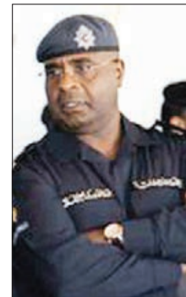
العميد عبدالله سفاح