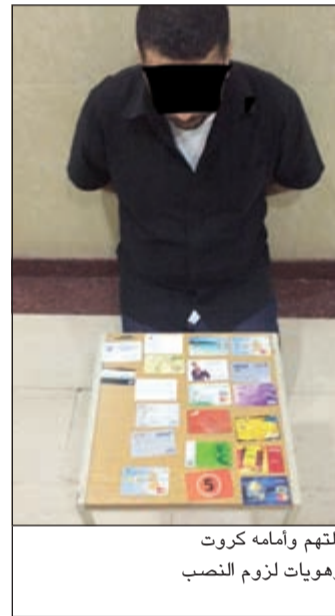
المتهم وامامه كروت وهويات لزوم النصب

مدین بمبالغ مالية تجاوزت الـ 200 ألف دينار. وذكر مصدر أمني ان معلومات وردت الى مدير عام المباحث الجنائية اللواء محمود الطباخ ان المواطن المطلوب وهو متورط في العديد من القضايا يواصل نشاطه في النصب، فتم الابعاز الى مباحث مبارك الكبير وتمكن فريق العمل من تحديد مكان وجوده بمنطقة الدعية وتمت مباغته فجرا وضبطه وعثر بحوزته على مجموعة من الهويات والتي يستعملها في العمليات الخارجة عن القانون.