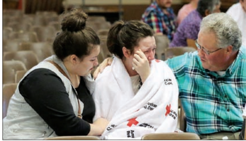
إحدى الناجيات من الحادث

'عندما لا يريد أحدهم التحدث لا يمكن لأحد أن يجبره على ذلك'. النجم البرتغالي كريستيانو رونالدو في أول حديث له منذ فترة طويلة إلى وسائل الإعلام بعد مباراة ريال مدريد ومالمو في أبطال أوروبا وتسجيله هدفي الفوز لفريقه.