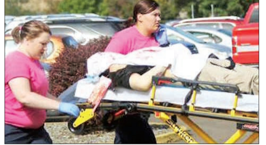
إحدى ضحايا المجزرة