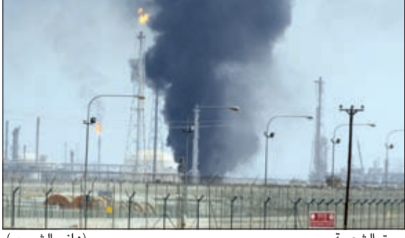
حريق الشعبية (هاني الشمري)