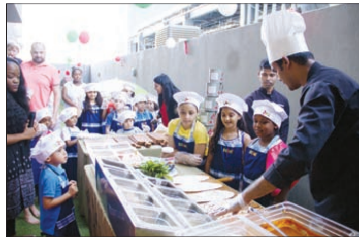
عدد من الأطفال يشاركون في صنع الأطباق