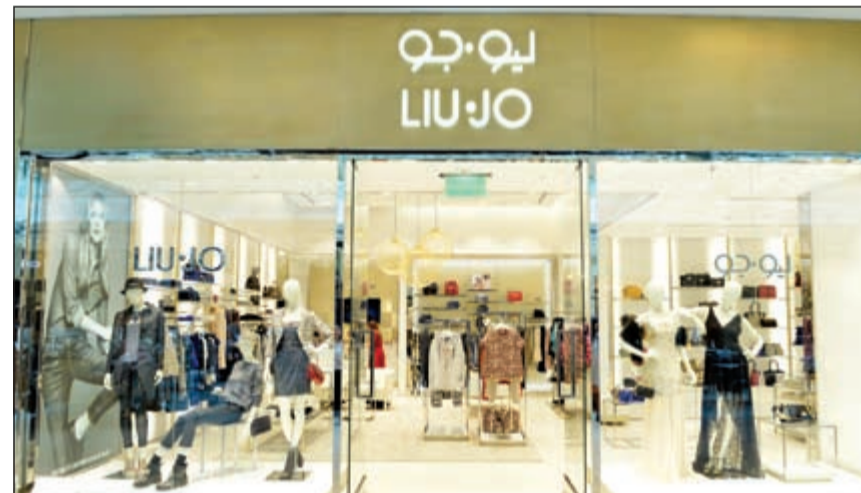
محل «ليو جو» يلبي رغبات جميع الباحثين عن الموضة المميزة

القديم و«الجينز» التي تمزج بين الأنوثة وطابع الروك بفضل هيمنة اللون الأبيض