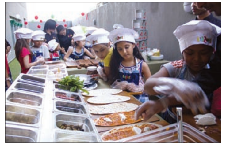
تعليم الأطفال جوانب من أطيب المطبخ الإيطالي

تعليم الأطفال الثقافة الإيطالية وأطيب المطبخ الإيطالي وذلك بالتزامن مع مساعي Kidzone التي تطلقها بصورة شهرية لتتقيف الأطفال حول مختلف الثقافات والحضارات في بلدان العالم. وقد قام الأطفال بلعب دور الطهارة فارتدوا المآزر والقبعات وعملوا على اختيار المكونات لتحضير البيتزا الخاصة بهم بأشد الاهتمام والعناية تحت