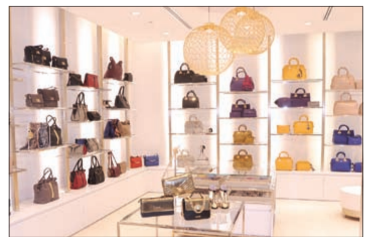
تشكيلة متنوعة من الحقائب النسائية الفخمة