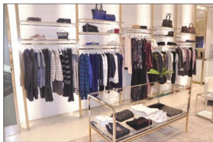
أزياء عصرية متنوعة من «ليو جو»