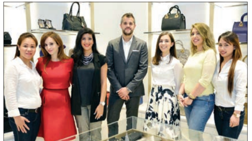
عدد من المشاركين في حفل الافتتاح