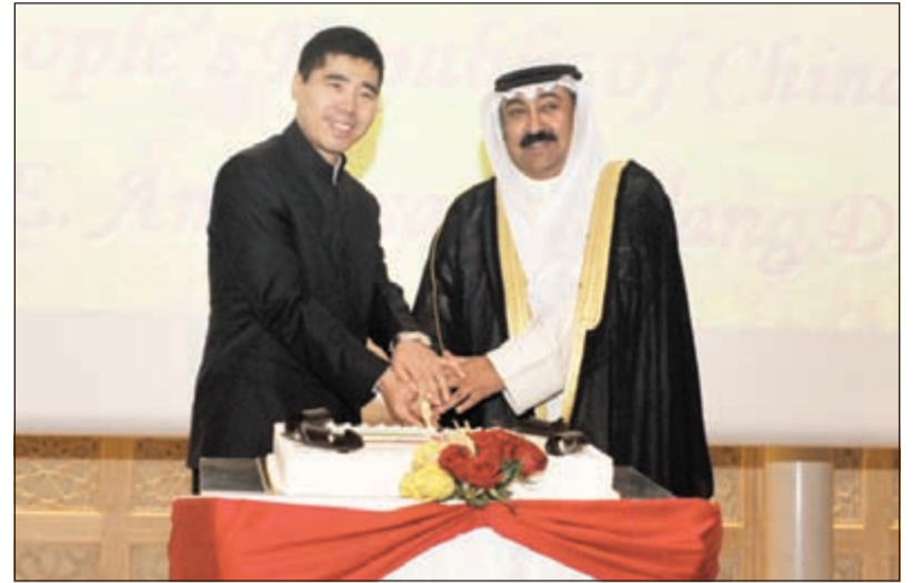
السفير وليد الخبزي مشاركا السفير الصيني وانغ دي قطع كعكة الاحتفال

عددا من الإنجازات الباهرة في كل مجالات بناء الدولة تحت مظلة القيادة الحكيمة لصاحب السمو حتى أصبحت الكويت لأول مرة بارة بشار إليها بالبنان في منطقة الخليج. أما الثانية فحرارة حماسة الشعب الكويتي للتعرف على آخر التطورات في الصين وسياساتها الخارجية، لافتا إلى أن جمهورية الصين الشعبية حققت قفزة نوعية في شتى المجالات وهذا ما أدى إلى تحسين مستوى المعيشة بشكل ملحوظ، كما حافظ الاقتصاد الصيني على معدل نمو يقدر بـ 7٪ وساهم بما يعادل 30٪ من حجم نمو الاقتصاد العالمي، أما الحرارة الثالثة فتتمثل في حرص الحكومة الكويتية على تطوير العلاقات الثنائية بين البلدين وهذا ما أكد له صاحب السمو الأمير خلال تقديم أوراق اعتماد.