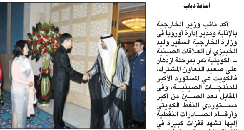
تهنئة من السفير الإماراتي رحمة حسين الزعابي

وشدد السفير وانغ دي على أن الكويت شريك مخلص يتمتع بثقة الجانب الصيني الذي يولي الاهتمام البالغ بتطوير صداقته مع الكويت. ووجه كلمة لأبناء الجالية الصينية قائلا: إن الوطن سيكون دائما سندنا لجمع الصنيتين وانتم أتيتم للكويت للعمل او للدراسة وبذلتم جهودا كبيرة في تقوية العلاقات بين البلدين والإسهام في التنمية الاجتماعية والمشاركة الفعالة في البناء الاقتصادي في الكويت، لافتا إلى أن السفارة ستعمل دوما لخدمة أبناء جاليتها وحماية حقوقهم ومصالحهم المشروعة.