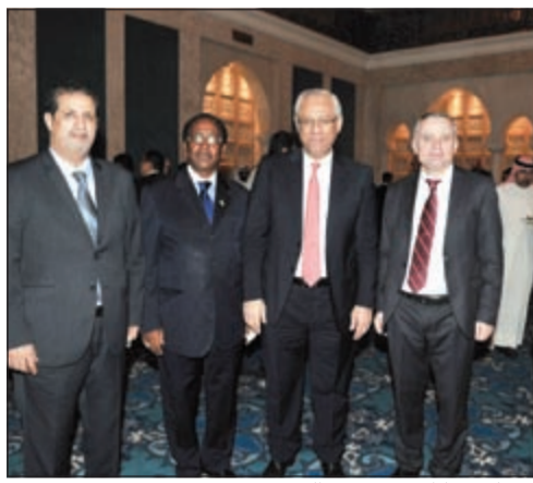
السفير المصري ياسر عاطف وعدد من الحضور

عددا من الإنجازات الباهرة في كل مجالات بناء الدولة تحت مظلة القيادة الحكيمة لصاحب السمو حتى أصبحت الكويت لأول مرة بارة بشار إليها بالبنان في منطقة الخليج. أما الثانية فحرارة حماسة الشعب الكويتي للتعرف على آخر التطورات في الصين وسياساتها الخارجية، لافتا إلى أن جمهورية الصين الشعبية حققت قفزة نوعية في شتى المجالات وهذا ما أدى إلى تحسين مستوى المعيشة بشكل ملحوظ، كما حافظ الاقتصاد الصيني على معدل نمو يقدر بـ 7٪ وساهم بما يعادل 30٪ من حجم نمو الاقتصاد العالمي، أما الحرارة الثالثة فتتمثل في حرص الحكومة الكويتية على تطوير العلاقات الثنائية بين البلدين وهذا ما أكد له صاحب السمو الأمير خلال تقديم أوراق اعتماد.