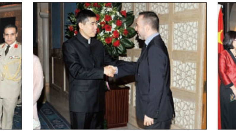
السفير الفرنسي كريستيان نخلة مباركا