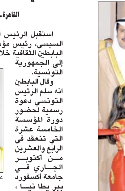
الشيخ عزام الصباح مشاركا في افتتاح مهرجان «الأيام الثقافي» 22»

وأثنى على مساهمة دور النشر في نشر الثقافة والإصدارات المتنوعة في المنطقة سواء على مستوى دول مجلس التعاون او الدول العربية.