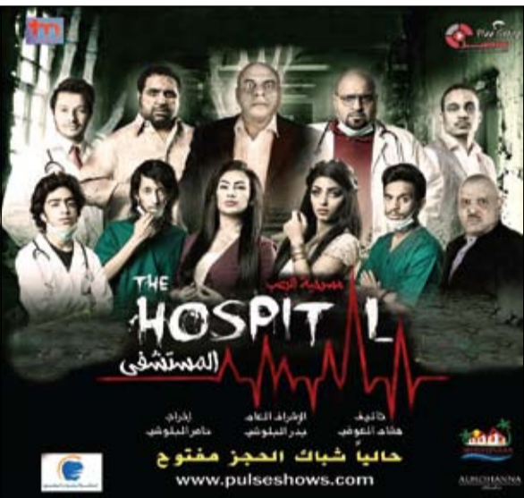
بوستر مسرحية «المستشفى»

وتابع: بعد نجاح هذا اللون من الأعمال المسرحية وتقبل الجمهور لهذا المسرح، أسمى لمواصلة العمل على هذا الخط، الذي أعشقه منذ الصغر، فأنا متابع جيد لأفلام ومسلسلات الربيع الأجنبية، وجار حاليا اعداد وتجهيز نص جديد سيرى النور قريبا وبفكرة