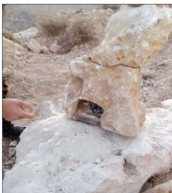
ضبط جهاز تنصت إسرائيلي مموه داخل إحدى الصخور في محلة بني حيان - مرجعيون (محمود الطويل)