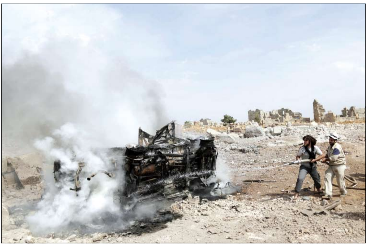
سوريان من حركة أحرار الشام يفتشان آلية استهدفتها إحدى الغارات الروسية في إدلب

والإن المقاتلات والقاذفات التابعة لسلاح الجو الروسي. من جهتها، نقلت رويترز عن قائد فصيل سوري معارض تأكيد أنه أحدى الضربات الروسية استهدفت معسكر تدريب لمقاتلين تربتهم المخبرات الأميركية لقتال داعش. وقال النقيب أبو الليث القائد العسكري لـ«لواء صفور الجبل»، المنضوي تحت لواء الجيش الحر، إن طائرات روسية استهدفت معسكر تدريب تابع للواء في محيط بلدة كفر نبل، بريف ادلب شمال سورية. وأوضح أبو الليث، وهو نقيب طيار منشق عن النظام السوري، في تصريحات أدلى بها للأناضول، أن «المقر تعرض لغارتين بصواريخ شديدة