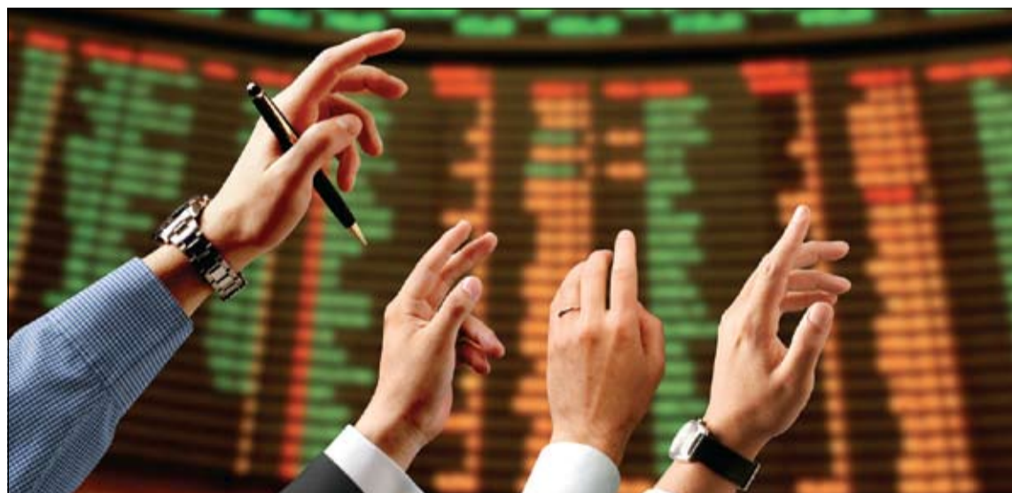
موجة إقبال المستثمرين على البيع تمثل أكبر انتكاسة للأسواق الناشئة منذ عدة سنوات

بشأن التدفقات الخاصة بالسندات في يوليو من 6 مليارات دولار إلى تدفقات خارجية قدرها 12 مليار دولار.