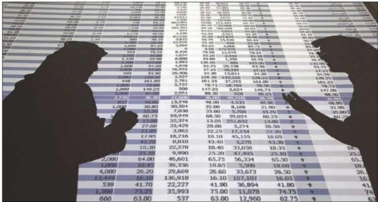
انحسار السيولة واتجاه المستثمرين إلى أسواق الخليج لزيادة استثماراتهم سامعوا في استمرار ضعف أداء مؤشرات السوق