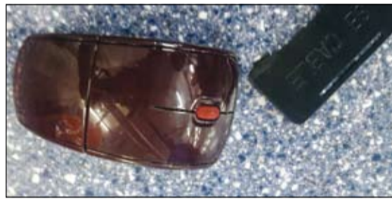
الموس لم يسلم من وضع الحبوب بداخله