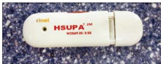
.. والفلاش أيضا وضع بداخلها حبوب هلوسة