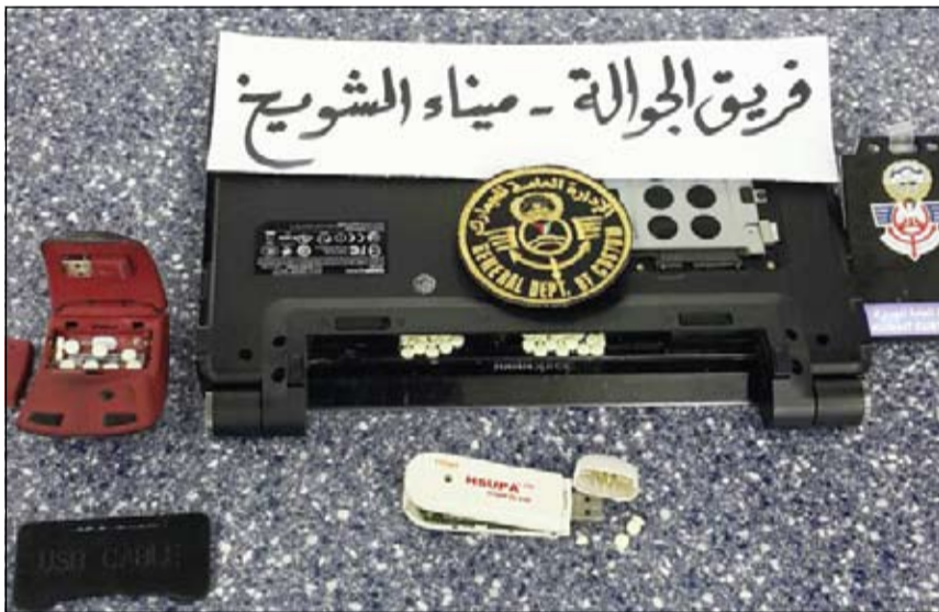
اللابتوب لغم بالحبوب