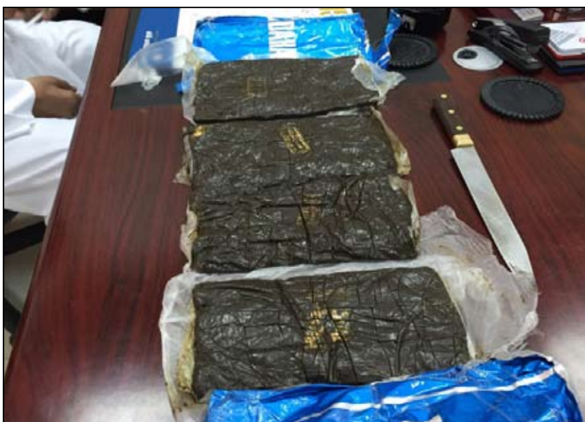
الحشيش الذي تم العثور عليه في المنفذ

عثر رجال جمرك العبدلي عصر امس على كمية كبيرة من مادة الحشيش ملقاة في احد جنبات المنفذ، وقدرت كمية الحشيش المضبوطة بأكثر من 10 كيلوغرامات من مادة الحشيش، وتم احطار الإدارة العامة للمباحث الجنائية لرفع المخدرات وفتح تحقيق في واقعة التهرب ضد شخص مجهول تخلص منها في المنفذ.