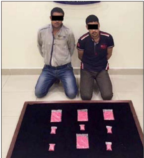
تاجرا الفراولة وامامهما حبوب الترامادول المخدرة

حيث تم عمل التحريات، وبعد ثبوت اتجاره بالحبوب تم استدرجه لبيع 50 حبة مقابل 120 دينارا، وفي الموعد المحدد حضر المتهم وتسلم المبلغ المرقم ليتم ضبطه، وبالتحقيق معه اعترف بأنه وآخر جلبا الحبوب بقصد الاتجار وارشد عن الكمية التي قاما بجلبها، حيث تبين انه جلب 10 آلاف حبة فيما جلب شريكه 5 آلاف حبة وضبط بحوزتهما 5 آلاف حبة لم تبع.