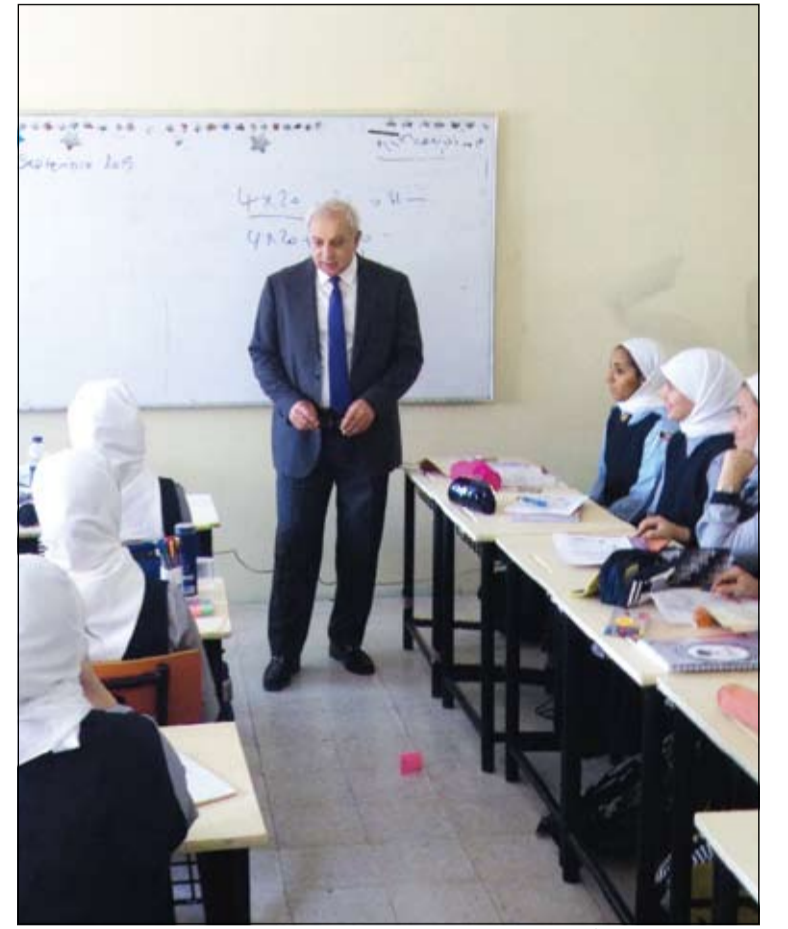
د. بدر العيسى داخل أحد فصول مدرسة ربيعة بنت الحارث

معنوية عالية للطلبة الذين أكدوا له صعوبة اختبارات الفترتين الثانية والرابعة كما أن هناك بعض الاختبارات الوقت فيها قصير وغير كاف لكي يؤدي الطالب اختبارها بكل أريحية، فرد الوزير العيسى عليهم قائلاً: «لا تحاتون وأنا أوكم».