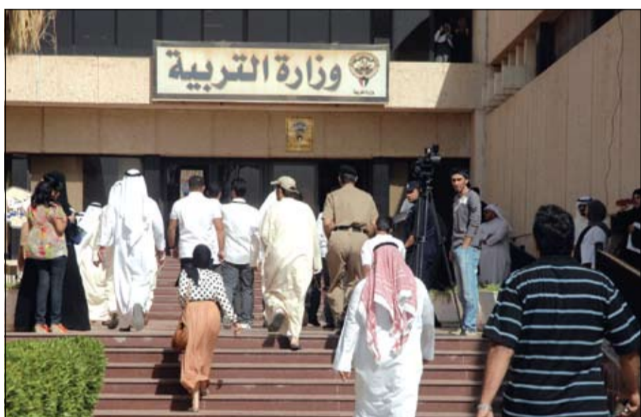
وزارة التربية تتابع العمل على إنجاز مشاريعها

كما يتضمن التقرير إنشاء 3 مواقع لمراكز تدريب المعلمين في المناطق التعليمية (الأحمدى - العاصمة - الفروانية) ومخاطبة بلدية الكويت بتخصيص المواقع في الفحيحيل وبنيد القار والرقي التي اشترطت إجراء دراسة مرورية لهذه المواقع. وأوصى التقرير بزيادة عدد الفصول في المباني المدرسية إلى 40 فصلاً خصوصاً في مدارس المناطق الجديدة لاستيعاب الزيادة الطلابية ودراسة إضافة دور للمبنى المدرسي وبناء سرداب لموقف سيارات الهيئة الإدارية والتعليمية بالمدارس، وتطبيق نظام المدارس الذكية والتعاون مع إدارة التخطيط في تحديد الاحتياجات من المباني المدرسية ودراسة وضع المباني القديمة التي تحتاج إلى هدم وإعادة