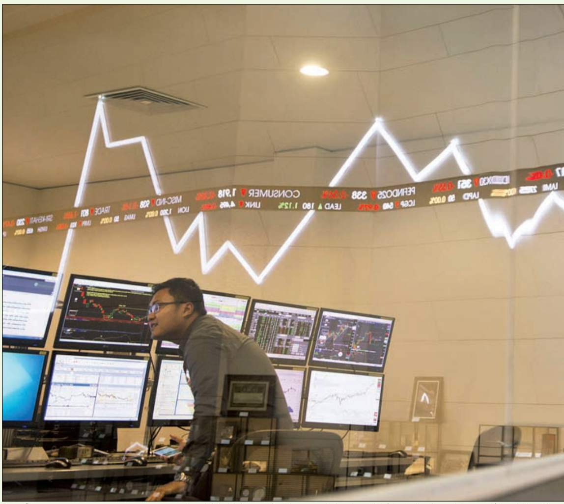
ضربة قوية تلقتها أسهم شركات تجارة السلع الأولية بعد إشارات إحدى شركات الشحن اليابانية إفلاسها