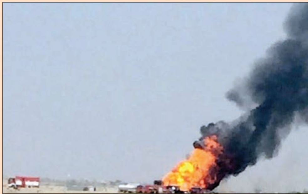
جانبا من عمليات الاطفاء في خط الغاز المشتعل أمس

أحمد مغربي منطقة المناقب. ووفقا لمصادر نفطية مسؤولة في الشركة لـ«الأنباء» فإن الحريق اندلع في الساعة الثامنة عشرة ظهرا في خط الأنابيب وتمت السيطرة عليه تماما ولم ينتج عن الحريق أي أضرار بيئية أو بشرية، كما لم ينتج عنه تسرب غازات سامة. وقالت المصادر إن عمليات التزود بالغاز في خط الأنابيب لم تتأثر إطلاقا من الحريق.