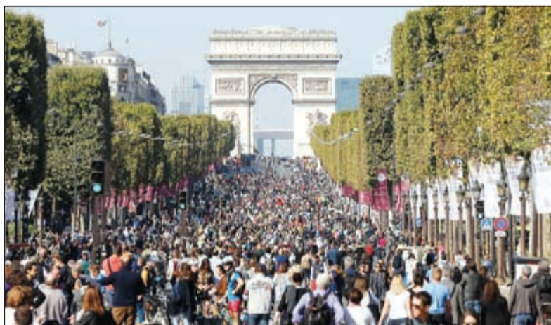
مئات الفرنسيين في الشوارع بلا سيارات

العام المقبل. بدورها، أعلنت السلطات المحلية للعاصمة أن هذه هي المرة الأولى التي ينظم فيها نشاط مماثل في باريس في إطار رسمي. ويأتي هذا النشاط في إطار التوجهات البيئية لبلدية باريس التي تعزز حظر السيارات والآليات العاملة بالديزل من السير في العاصمة بحلول العام 2020.