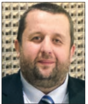
الودين محمود ديفت

وكذلك حرصاً من الشركة على راحة جميع العملاء فقد تمت مراعاة ذوي الاحتياجات الخاصة والمرضى وكبار السن ونزلاء مصحة نيرما للعلاج الطبيعي سواء في تصميم المبني أو في الخدمات المقدمة لهم. وذلك كله لتشجيع وتدعيم فكرة الاستثمار. وأضاف وقد وضعت الشركة دراسة جدوى شاملة عن العوائد الاستثمارية التي سيحققها المالك للوحدة عن طريق تأجيرها لزوار ورواد المعالم السياحية في «البحا» والقاصدين مصحة نيرما للعلاج الطبيعي والتي تقع بجانب المجمع وأيضا يمكن تأجير الوحدة للطلاب الدارسين بالجامعات الخاصة هناك والتي توجد بالقرب من المجمع وذلك في أيام الدراسة وأيضا تأجيرها في فصل الشتاء