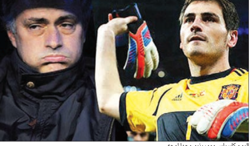
اليوم كاسياس ومورينو وجها لوجه

الفريق 2-2 مع ضيفه دينامو كييف الأوكراني في المجموعة السابعة، ليعادل 15 بالدوري المحلي.