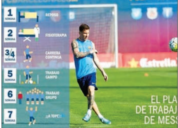
مرحل عودة ليو

والخل هذه الأيام الأولى نصح الأطباء بأن يستخدم العسكارات لتجنب أضرار الركبة، ومن المرتقب ألا يعاني الأرجنتيني من آلام كبيرة ابتداء من اليوم 4 أو 5، وبالتالي فيبعد الأسبوع الأول سيكون نجم البلوغرانا متاحا لأبدي أخصائي العلاج الطبيعي والذين سيلعبون دورا مهما لإعادة تأهيله. وسيكون العلاج الطبيعي مهما أثناء مرحلة انتعاشه، إذ إن العلاج سيسمح للإصابة بان تتعافى ويعدها ستأتي مرحلة ارتدائه للأحذية وبدء الجري على أرضية الميدان وسيكون ذلك في