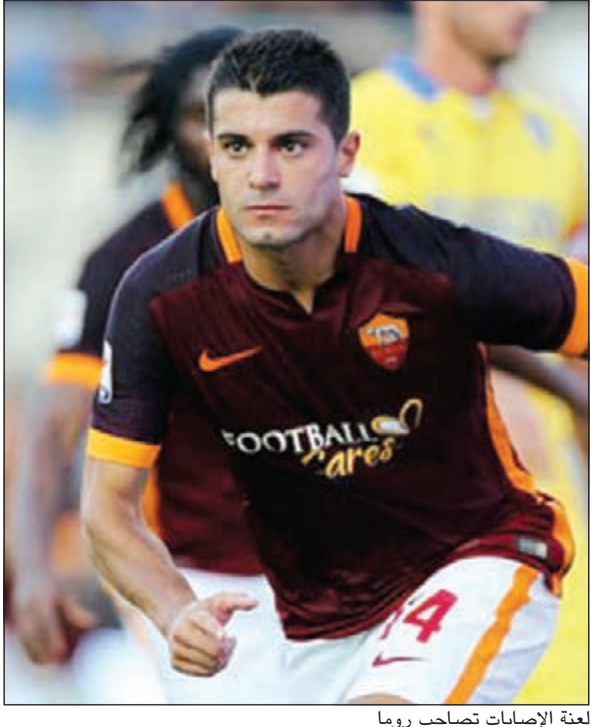
لعنة الإصابات تصاحب روما

لعنة الإصابات أصبحت تجوب في أزقة نادي روما الإيطالي، فبعد تأكيد إصابة فرانچيسكو توتي وإيدن دزيكو وغياهما لمدة شهر، وكذلك إصابة توريا وغياهما لمدة، ظهر ضحية جديدة في الفريق. ونقل موقع «التوتو ميركاتو» الإيطالي عن شبكة «سكاي سبورتس» تأكيد غياب ياجو فالكي لاعب ذئاب روما عن تدريبات الفريق، وتصبح مشاركته في مباراة باي بوريوسوف الروسي بدوري الأبطال صعبة للغاية. يذكر أن روما تعادل في مواجهته الأولى بالشمابيونزليغ أمام برشلونة بهدف لكلا الفريقين، على ملعب الأولمبيكو، ليحتل بها المركز الثاني برصيد نقطة وحيدة في المجموعة الخامسة، فيما يتصدر باير ليفركوزن الألماني المجموعة عقب الفوز على باي بوريوسوف بنتيجة 4-1. وسيدبر لقاء بوريوسوف الإنجليزي الدولي مارك