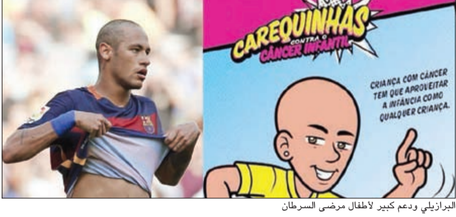
البرازيلي ودعم كبير لاطفال مرضى السرطان

فريق لاس بالماس حليق الرأس، بشكل فاجأ الجميع. ومن المعروف عن نيمار اهتمامه الشديد بشعره، والحرص على أن يقوم بتسريحات غريبة، ارتبطت جميعها بشخصيته، وبات الشباب يقلدون في جميع أنحاء العالم، وقد تساهم هذه المباراة من نيمار في انتشار حملة عالمية للتعاطف مع الأطفال مرضى السرطان. بدوره، نشر الدولي التشيلي كلاوديو برفاو حارس مرمر برشلونة على حسابه الرسمي بموقع الصور «انستغرام» تحفيزا كبيرا لناديه وزملائه قبل مواجهة باير ليفركوزن. وعاد برفاو إلى تدريبات الفريق الكاتالوني بعد الشفاء من إصابة في أوتار الركبة وجاءت الصورة بجانب البرازيلي نيمار. وأشار إلى انه حظي بيوم مميز بجانبه.