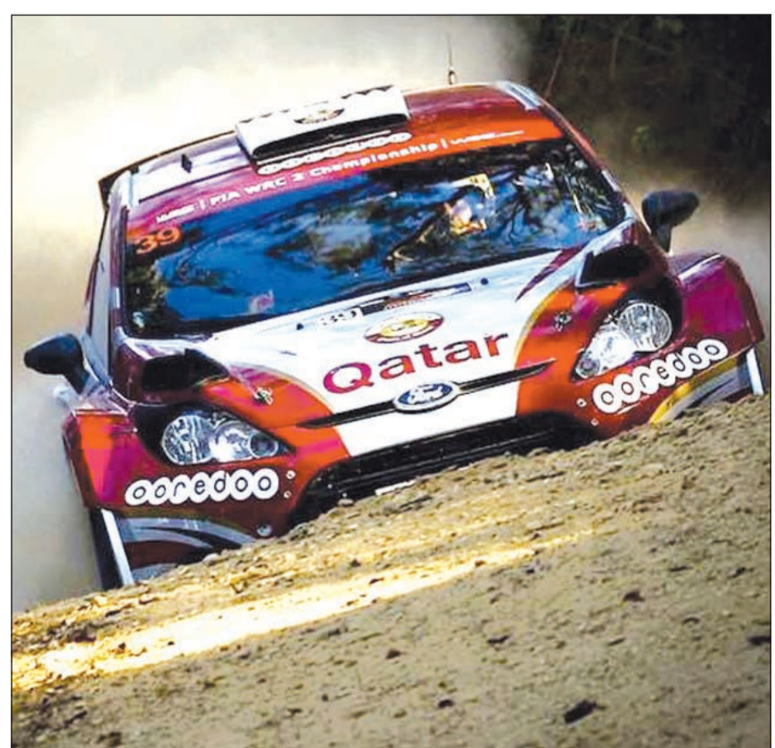
سيارة القطري ناصر بن صالح العطية

على تحقيق إنجاز قطري جديد في بطولة الشرق الأوسط للراليات وهذا ما سوف نؤكد فيما تبقى من جولات لهذا الموسم والمتمثل برالي الأردن ثم رالي عمان وصولا إلى الجولة الختامية رالي دبي. الترتيب الحالي لبطولة الشرق الأوسط للراليات مع انتهاء رالي قبرص: الترتيب السائق النقاط 1- ناصر العطية (قطر) 100 2- خالد القاسمي (الإمارات) 51 3- عبدالعزيز الكواري (قطر) 48 4- خالد السويدي (قطر) 32 5- صلاح بن عيدان (الكويت) 26 5- خليفة العطية (قطر) 26 7- روجيه فغالي (لبنان) 25 8- نيكولا أميوني (لبنان) 18 9- راشد النعيمي (قطر) 16 10- يزيد الراجحي (السعودية) 15 10- تامر غندور (لبنان) 15 10- سيمونس غلاتاريوتيس (قبرص) 15