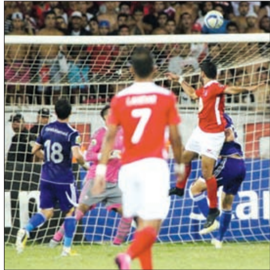
أحد الأهداف الخمسة

من لاعبي كلا الفريقين مما أعطى انطباعا فاترا عن مستوى الشوط الاول الذي انتهى بالتعادل السلبي. اما الشوط الثاني فلم يكن أفضل حالا من سابقه بل جاء مشابها له إلى حد التطابق باستثناء آخر 20