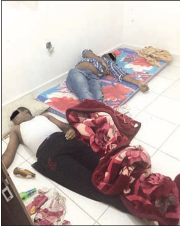
جثتا الوافدين قبل إحالتهما إلى الطب الشرعي

الطب الشرعي أسباب الوفاة بصورة دقيقة للاستعانة بتحليلات طبية وأغراض رفعت من جوار الجثتين. يذكر ان البلاغ كشف عن قيام مواطن بتأجير قسيمته للعراب.