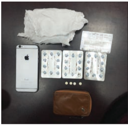
الحيوب المضبوطة بين مخدرة وأخرى زرقاء