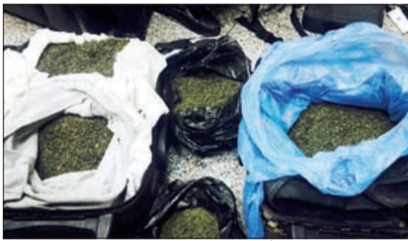
20 كيلو قات ضبطت مع الآسيوية

مخابي سرية تحتوي على 4 كيلوغرامات من مادة الماريغوانا، اما الوافد العربي عليه الارتباك، فتم تفتيش امتعته بدقة والعثور في ثنية البنطلون على قطعة من الحشيش قال انه جلبها بقصد التعاطي نظرا لغلاء الحشيش محليا وصعوبة الحصول عليه، حسب زعمه. وبالنسبة للوافدة الآسيوية، قال الفهد: انه تم الاشتباه بها وبتفتيش امتعتها عثر بحوزتها على 20 كيلوغرام قات قالت انها بصدد تسليمها الى احد مواطنيها.