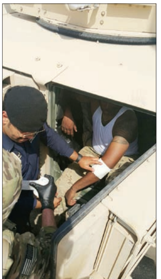
رجل النجدة يقدم الاسعافات العاجلة للجندى الاميركي