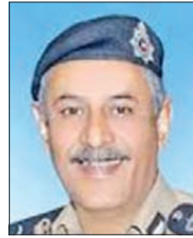
لواء زهير النصرالله

وجاء انتقال الادلة الجنائية الى منطقة الصباحية بعد إخطار العقيد مشعل الخميس مدير عام النجدة اللواء النصرالله بأن البلاغ الذي جرى التعامل معه كشف عن وفاة آسيويين. وبحسب مصدر أمني، فإن عمليات وزارة الداخلية تلقت بلاغا من وافد آسيوي ابلغ خلاله انه عاد الى مسكنه متاخرا ووجد صديقته جثتين هامدتين، وعلى الفور انتقل الى موقع البلاغ رجال النجدة والامن العام بتقديمهم العميد عبدالله سفاح، وتبين لدى معاينة الجثتين عدم وجود اي طعنات او ما يشير الى وقوع جريمة قتل او اعتداء من اي نوع، كما تبين ان الباب