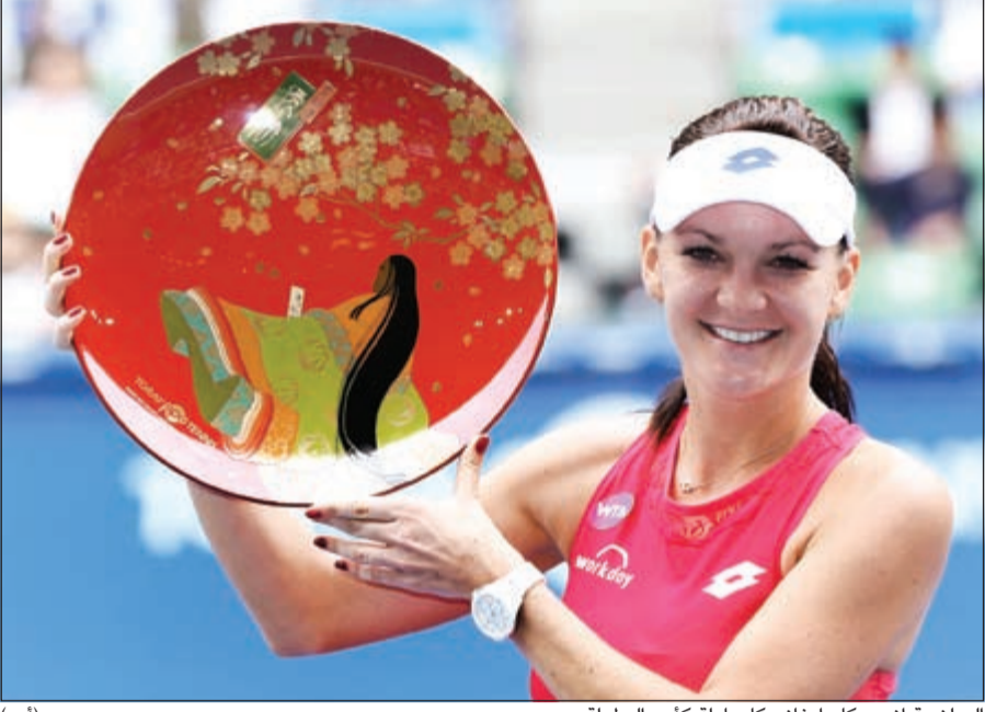
البولندية انيسكا رادفانسكا حاملة كأس البطولة

سفتلانا كوزنستوفا والسلوفاكية دانييلا هانتوتشوفا والاسرائيلية سامانتا ستوسور من الدور الأول لدورة ووهان الصينية الدولية للتنس البالغ مجموع جوائزها 2.12 مليون دولار.