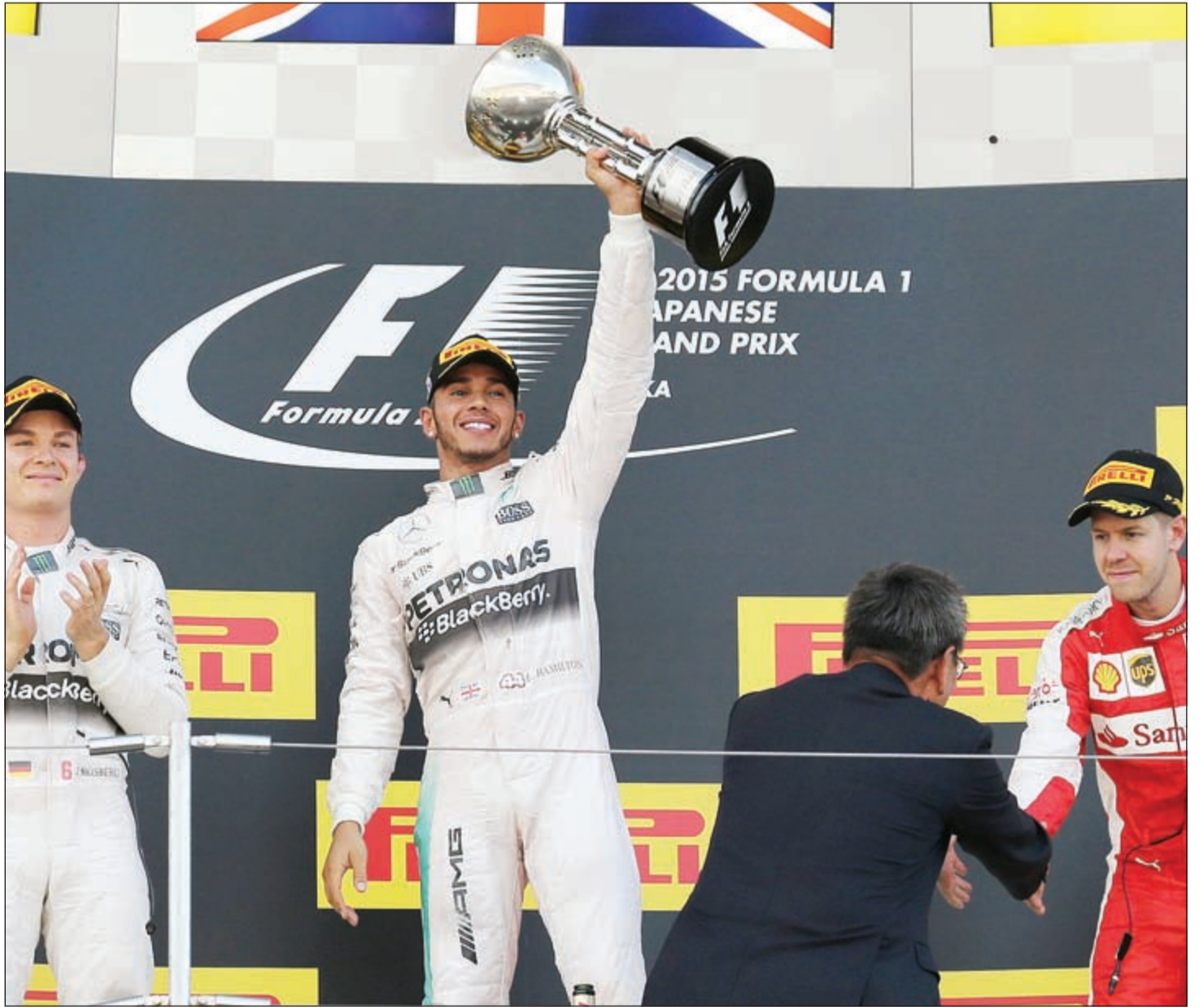
هاميلتون يعود لمنصات التتويج من جديد

سايينز حونيور (تورو روسو/رينو) ترتيب بطولة العالم: 1- البريطاني لويس هاميلتون نقطة 277 2- الألماني نيكو روزبرغ (مرسيدس) 229 3- الألماني سيباستيان فيتيل (فيراري) 218 4- الفنلندي كيمي رايكونن (ويليامس/مرسيدس) 119 5- الفنلندي فالتييري بوتاس (فورتس انديا مرسيدس) 111 7- الفرنسي رومان غروجان (لوتوس/مرسيدس) 8- الفنلندي باسستور مالدونادو (لوتوس/مرسيدس) 9- الهولندي ماكس فيرشتابن (تورو روسو/رينو) 10- الإسباني كارلوس