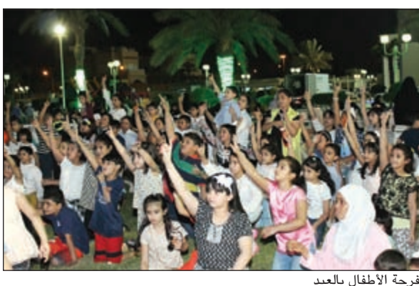
فرحة الأطفال بالعيد