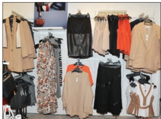
تشكيلة متنوعة تلبى جميع الأذواق