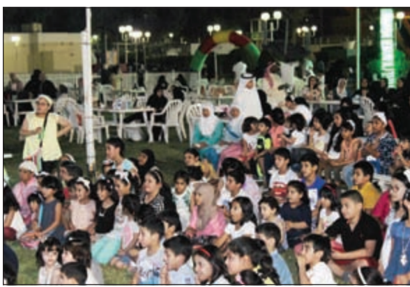
الأطفال يتابعون إحدى الفقرات