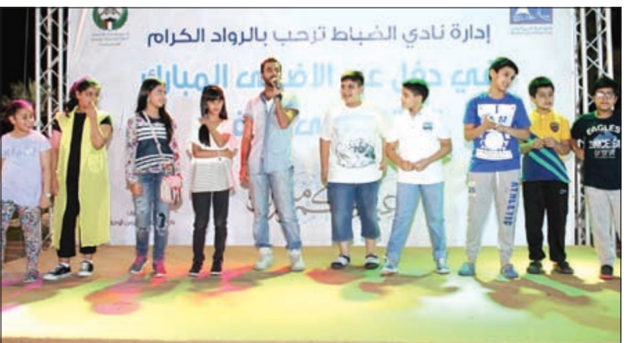
إحدى فقرات الحفل

نظم نادي ضباط الحرس الوطني حفلاً لاسر الضباط والأعضاء بمناسبة عيد الأضحى المبارك وذلك ثالث أيام العيد من أجل إضفاء البهجة والسرور عليهم، وتحقيق التواصل الأسري بين الضباط وعائلاتهم وتخفيف ضغوط العمل عنهم. وشهد الحفل حضوراً مكثفاً من قبل الأسر مستمتعين بأجواء العيد الأسرية. وقد أعدت إدارة نادي ضباط الحرس الوطني العديد من البرامج والفقرات والمسابقات التي نالت