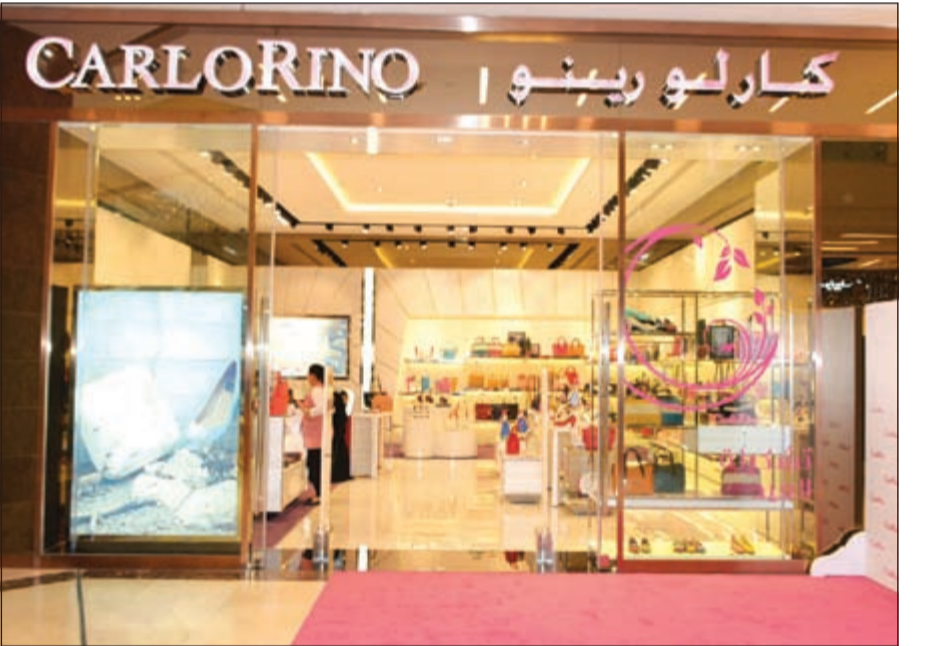
بوتيك «كارلو رينو» في «ذي جيت مول»

قاعدة جماهيرية كبيرة محلياً وعالمياً، إذ تخطت شهرتها حدود البلد لتصل إلى ماليزيا وبروناي وهونغ كونغ وتايواندا، إضافة إلى فيتنام واندونيسيا وميانمار والصين، وكذلك اليابان وفنلندا، وصولاً إلى العالم العربي مثل سلطنة عمان والمملكة العربية السعودية والكويت. وتجدر الإشارة إلى أن بوتيك كارلورينو موجود في الدور الأرضي، في ذي جيت مول.