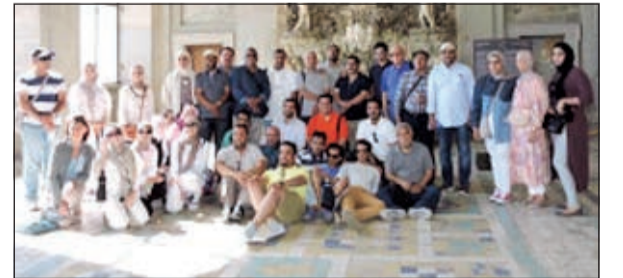
صورة جماعية للوفد الكويتي في أحد المتاحف