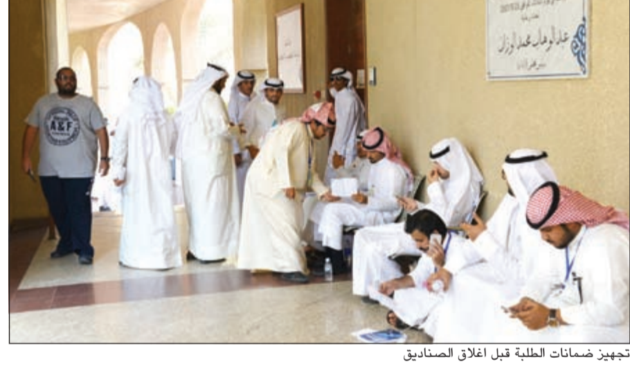
تجهيز ضمانات الطلبة قبل اغلاق الصناديق