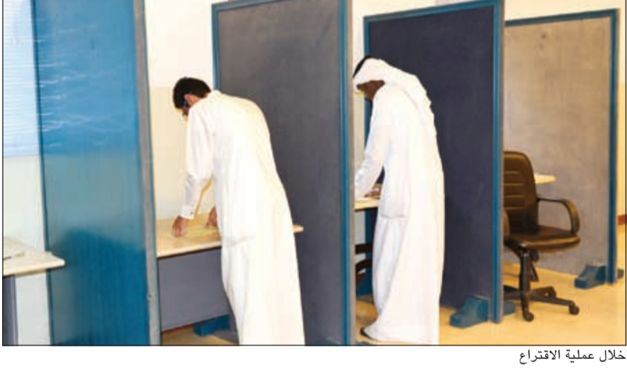
خلال عملية الاقتراع

● تعتمد اللجنة العليا في جميع الكليات من قبل عمادة القبول والتسجيل وهي أسماء تمت مراجعتها من قبل موظفين مختصين في