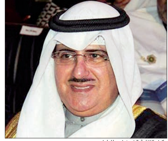
وكيل الإذاعة الشيخ فهد المبارك