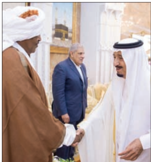
خادم الحرمين مستقبلاً بكرى حسن صالح

لنا بالنتائج في أسرع وقت ممكن لا يقلل مما تقومون به من أعمال جليلة لخدمة ضيوف الرحمن ليؤدوا مناسكهم ببسر وراحة وسكينة. ويغض النظر عما يظهر من نتائج التحقيقات فإن تطوير آليات وأساليب العمل في موسم الحج لم ولن يتوقف وقد وجهنا الجهات المعنية بمراجعة الخطط المعمول بها والترتيبات كافة بالأدوار والمسؤوليات المناطة بمؤسسات الطوافة والجهات الأخرى وبذل كافة الجهود لرفع مستوى تنظيم وإدارة حركة ومسارات الحجاج بكل يسر وسهولة، وسيتم العمل على تذليل كافة المعوقات والصعوبات ليتسنى لضيوف الرحمن أداء مناسكهم في راحة وطمأنينة، فواجبنا كبير ومسؤوليتنا عظيمة في خدمة ضيوف الرحمن وهو شرف نعتز به، نسأل المولى عز وجل أن يأخذ بأيدينا ويوفقنا جميعاً في أداء هذه المهمة العظيمة الجليلة». وأوضح: «في هذه المناسبة المباركة لا ننسى إخوة لنا يذودون عن وطنهم الغالي ويضحون بأرواحهم في الدفاع عن بلادهم، فهم وأنتم بعد الله حماة الوطن ودرع الحصينة،