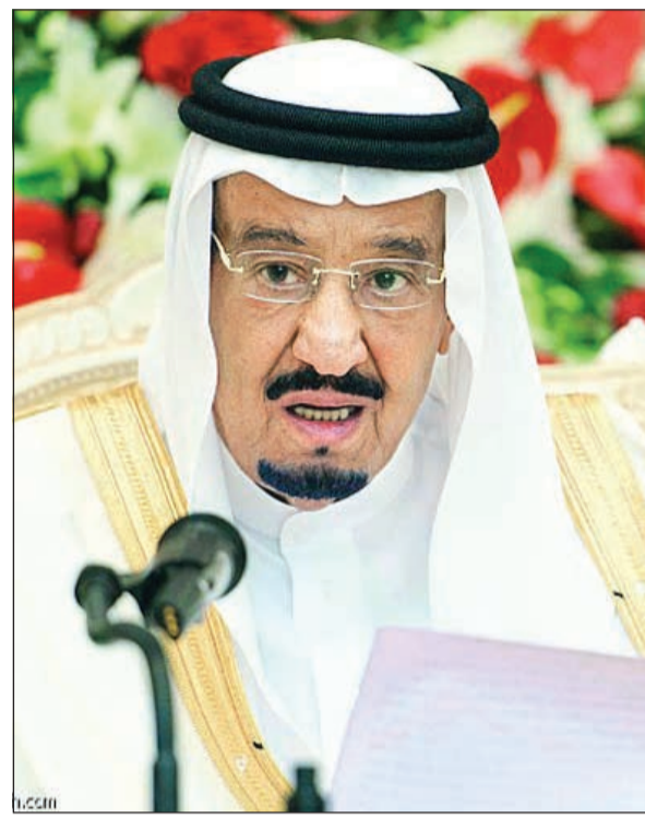
خادم الحرمين الشريفين الملك سلمان بن عبدالعزيز

الرياض - واس: أكد خادم الحرمين الشريفين الملك سلمان بن عبدالعزيز القائد الأعلى لكافة القوات العسكرية حرص السعودية على لم الشمل وعدم السماح لعبث الأيدي الخفية. وقال الملك سلمان في كلمته التي ألقاها خلال حفل الاستقبال السنوي في الديوان الملكي بقصر منى أمس لقادة الدول الإسلامية، وكبار الشخصيات الوفود ومكاتب شؤون الحج والعمرة، «إننا من موقع مسؤوليتنا العربية والإسلامية، وانطلاقاً من دور المملكة العربية السعودية الإقليمية والعالمية نؤكد حرصنا الدائم على لم الشمل العربي والإسلامي، وعدم السماح لأبياد خفية بأن تعبت بذلك، ونحن نتعاون مع إخواننا وأشقائنا في دعم الجهود العربية والإسلامية لما فيه الخير والاستقرار».