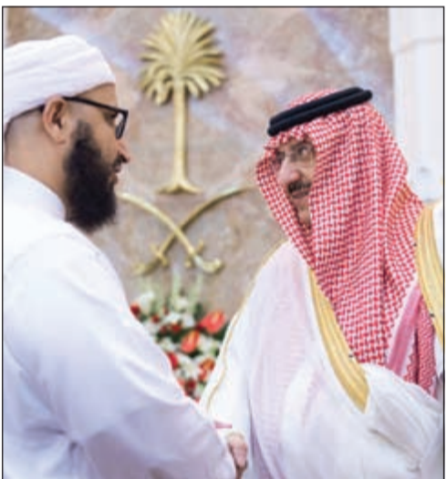
..وصاحب السمو الملكي الأمير محمد بن نايف مستقبلاً أحد الضيوف