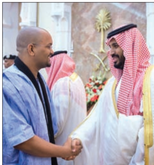
..وصاحب السمو الملكي الأمير محمد بن سلمان مع أحد الضيوف

بيروت - واس: أعرب الأمين العام للمجلس الإسلامي العربي في لبنان محمد علي الحسيني عن تقديره لجهود حكومة خادم الحرمين الشريفين الملك سلمان بن عبدالعزيز آل سعود في خدمة ضيوف الرحمن وما تقدمه من تسهيلات لهم لاداء نسكهم بكل يسر وسهولة. وقال الحسيني في تصريح صحافي أمس إن «موسم الحج لهذا العام واجه تحديات وصعوبات جمة أبرزها وأهمها التحديات المناخية والأمنية خصوصاً أن المنطقة بصورة عامة تجتاحها حمى التطرف والإرهاب وأن هناك أكثر من جانب يترصد بالمملكة التي كان لها وعلى الدوام قيادة حكيمة ورزينة تعرف كيف تتصرف وتتعامل مع الأمور». وأضاف أن حكومة خادم الحرمين الشريفين وتوجهاته السديدة قامت بدور كبير في تذليل تلك التحديات وسهلت الأمور لضيوف بيت الرحمن».