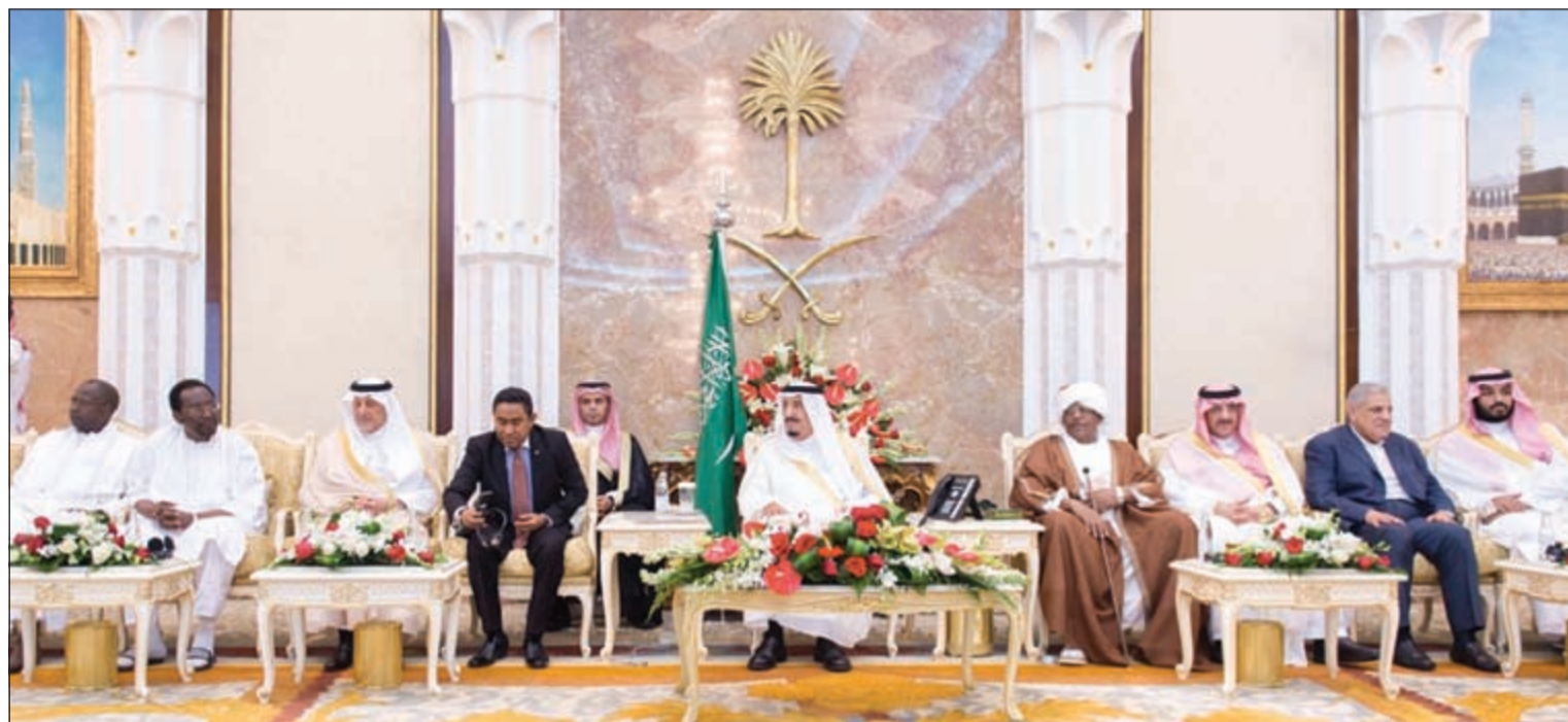
خادم الحرمين الشريفين الملك سلمان بن عبدالعزيز يتوسط مجموعة من قادة الدول الإسلامية وكبار الشخصيات الإسلامية ممن أدوا فريضة الحج هذا العام بحضور اصحاب السمو الملكي الأمير محمد بن نايف ومحمد بن سلمان وخالد الفيصل