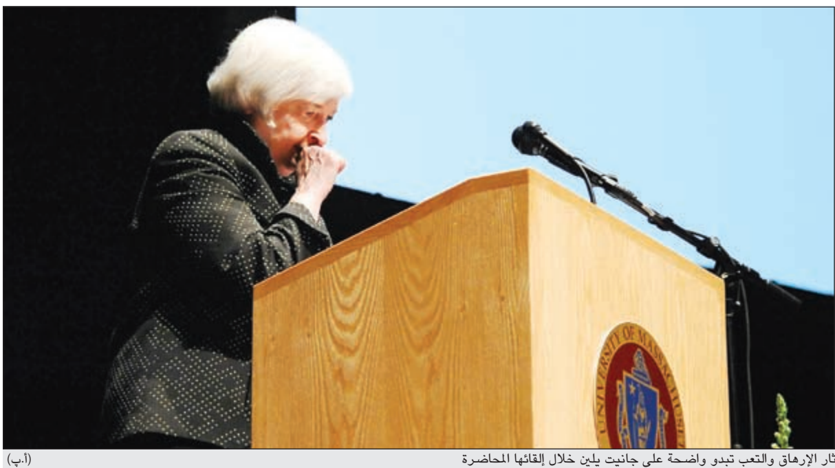
آثار الإرهاق والتعب تبدو واضحة على جانيت يلين خلال إلقائها المحاضرة (أ.ب)

الضغوط التضخمية وقالت: «الجانب الأكبر من ضعف الضغوط التضخمية مؤخرا يرجع إلى عوامل خاصة ومؤقتة على الأرجح مثل قوة الدولار وضعف أسعار النفط وهو ما يسرع للتضخم في الولايات المتحدة بان يرتفع إلى مستوى 2/2