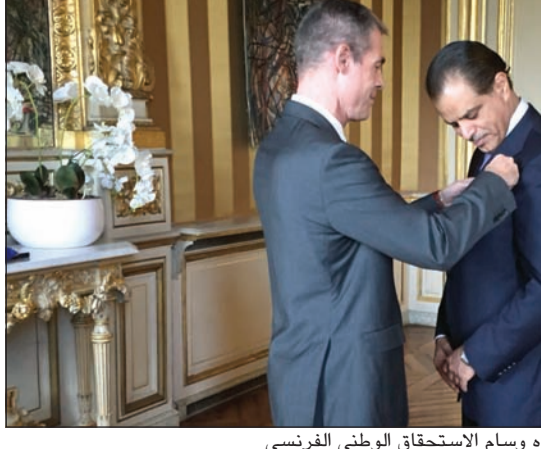
السفير علي سليمان السعيد أثناء تقلده وسام الاستحقاق الوطني الفرنسي

وأضاف العتيقي خلال حفل استقبال اقامته الجمعية مساء امس الاول لاستقبال المهنيين بمناسبة عيد الاضحى المبارك في مقرها بمنطقة الروضة ان جمعية الإصلاح الاجتماعي تتقدم بالتهاني والتبريكات القلبية المعظمة بالحب والتقدير بمناسبة عيد الاضحى المبارك لامة الاسلام ولصاحب السمو الامير الشيخ صباح الاحمد وسمو ولي العهد الشيخ نواف الاحمد ورئيس واعضاء مجلس الأمة وإلى الحكومة الرشيدة والشعب الكويتي الكريم باسمي آيات التهاني والتبريكات، داعيا المولى عز وجل ان يحفظ الأمة الإسلامية والبلاد من كل شر وان يديم نعمته علينا والجميع بالخير والبركات. وأوضح ان الاحتفال بالعيد وسط حشد من كل اطياف المجتمع الكويتي يمثل صورة من صور الوحدة والتماسك