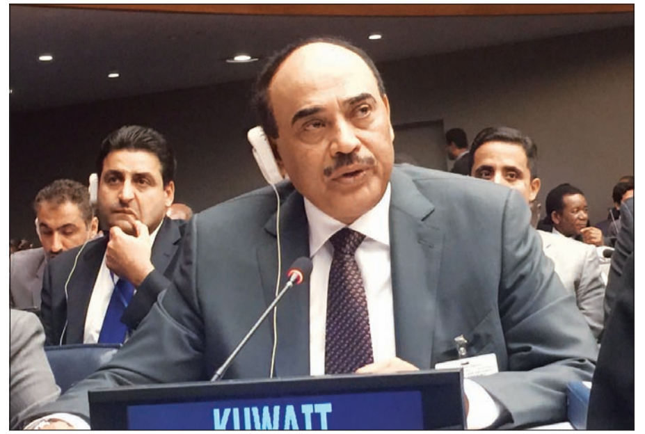
النائب الأول لرئيس مجلس الوزراء ووزير الخارجية الشيخ صباح الخالد أثناء لقائه كلمته

هنا اليمن على عودة الرئيس عبدربه منصور هادي إلى عدن وأجرى مباحثات مع وزيرة خارجية كرواتيا ووزير خارجية إندونيسيا