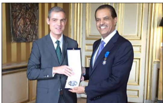
السفير السعودي خلال تسلمه وسام الاستحقاق الوطني الفرنسي

مختلف الإصعدة السياسية والاقتصادية وتعزيز الروابط الثقافية بين البلدين الصديقين. وقال بونافون أن «السعيد كان خير من دفع بالعلاقات بين فرنسا والكويت إلى الامام لذلك امر الرئيس الفرنسي بدمحه وسام الاستحقاق بدرجة ضابط أكبر الذي لم يتم منحه الا لعدد قليل جدا من السفراء نظير قيامهم بجهود متميزة تساهم في تعزيز اواصر الصداقة مع فرنسا». من جانبه، اعرب السفير السعودي في كلمته عن الشكر