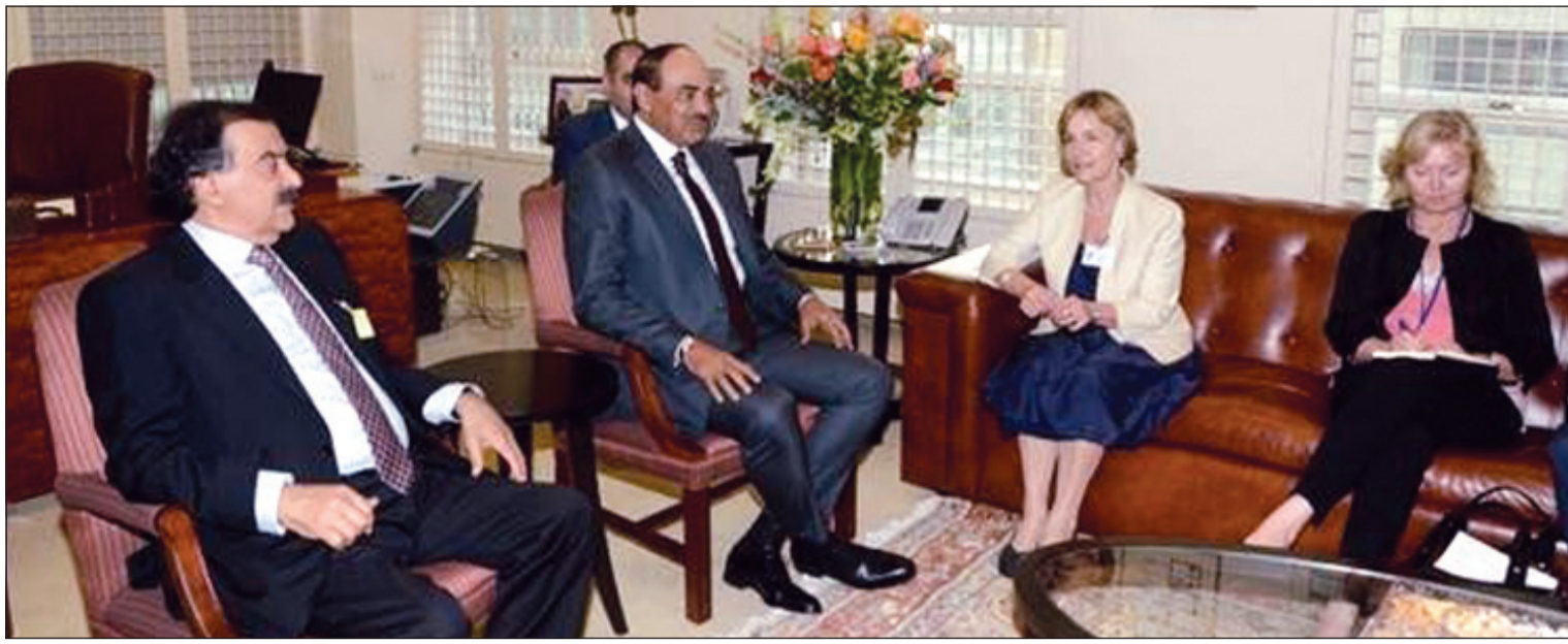
الشيخ صباح الخالد خلال المحادثات مع وزيرة خارجية كرواتيا فيسنا بوسيك بحضور خالد الجارالله