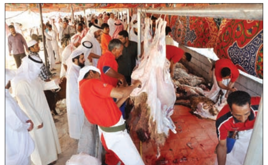
المسالخ الفرعية نجحت في القضاء على طوابير الانتظار (أحمد علي)