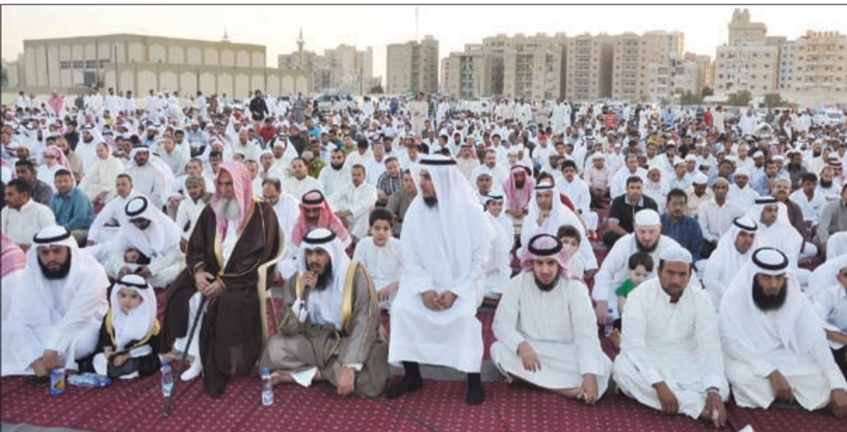
المسلمون تدفقوا إلى الساحات والمساجد لتأدية صلاة العيد أمس (أحمد علي)

المخاطر والتحديات، كما أن توحيد صفوف المجتمع ولقاء الأمة ودوام دولتها ونجاح رسالتها. • التفاصيل ص6