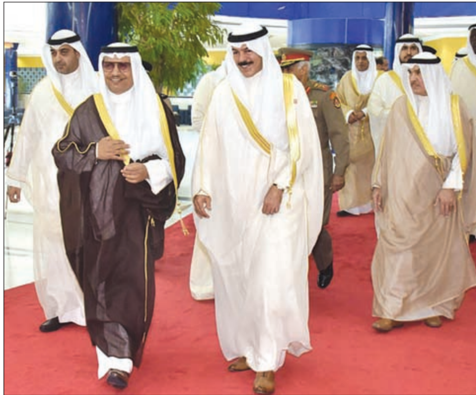
سمو رئيس الوزراء الشيخ جابر المبارك لدى وصوله إلى نادي ضباط الشرطة وفي استقباله الشيخ محمد الخالد والشيخ محمد العبدالله

قالت مصادر رفيعة في تصريح لـ «الأنباء» ان ممثل صاحب السمو الأمير الشيخ صباح الأحمد سمو رئيس مجلس الوزراء الشيخ جابر المبارك سيغادر البلاد غدا السبت لإلقاء كلمة الكويت أمام الجمعية العامة للأمم المتحدة المقررة 29 الجاري. وبحسب المصادر يؤكد سموه في الكلمة على الدور الذي تقوم به الكويت في دعم الجهود والمبادرات الدولية الإنسانية لمساندة بعض الشعوب نتيجة تعرض دولها إلى نزاعات وحروب وكذلك الدعم الذي قدمته سواء على صعيد استضافة الكويت 3 مؤتمرات لدعم الشعب السوري إلى جانب كل أشكال الدعم الأخرى التي قدمتها للشعب اليمني وشعوب بعض دول العالم. وأضافت المصادر ان كلمة سمو رئيس مجلس الوزراء الشيخ جابر المبارك ستستغرق إلى جهود الكويت في تعزيز ودعم ونشر ثقافة الأمن والسلام ومحاربة كل أشكال الإرهاب والعنف وتشجيع الحوار بين الأديان والحضارات ودعم واحترام حقوق الإنسان انطلاقا من التمسك بالدستور والنهج الديموقراطي الذي تؤمن به.