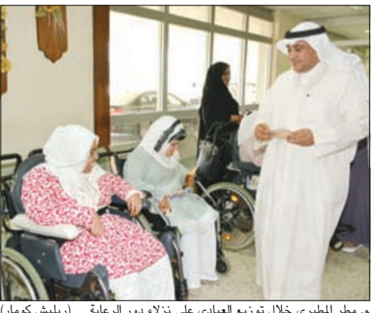
م. مطر المطيري خلال توزيع العيادي على نزلاء دور الرعاية

كشفت وكيل وزارة الشؤون الاجتماعية د.مطر المطيري عن صدور قرار بوقف جميع التنقلات بين الوحدات التنظيمية في وزارة الشؤون اعتبارا من أول أكتوبر المقبل بهدف تحقيق الاستقرار الوظيفي والانتهاه من إعداد تقارير الكفاءة الوظيفية، على أن يتم تسليم التقارير خلال آخر 90 يوما من السنة الميلادية ليتم توزيعها في جميع الإدارات بداية من شهر يناير ليقوم المديرين والمراقبون ورؤساء الأقسام بتقييمها بشكل واضح وبكل شفافية. جاء ذلك في تصريح صحفي له صباح أمس على هامش زيارته لمجمع دور الرعاية الاجتماعية لتقديم التهاني والتبريكات بمناسبة العيد. وأكد المطيري أن العمل في قطاع الرعاية الاجتماعية