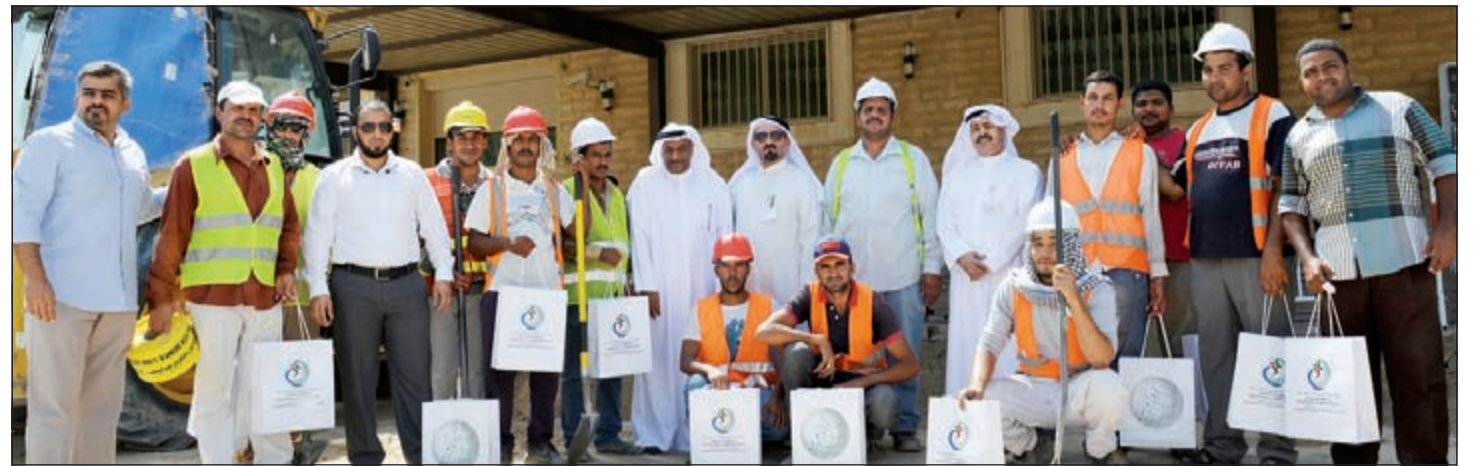
لقطة جماعية للعاملين في الشركة مع عمال الطرقات

وتزخر مجموعة «ترايشيغال بيزيكس» بتصاميم جميلة تمتاز بأقمشتها وتشطيباتها فائقة النعومة لضمان راحة الطفل قدر المستطاع. وتلبي هذه المجموعة مختلف احتياجات الطفل بدءاً من أفرولات وقفزات الأطفال حديثي الولادة، وانتهاء بالسترات الصوتية والجوارب. وأخيراً، تستمد مجموعة «أوكيجن ويسر» الهامها من سحر الأيام الماضية، وتتميز فيها إضافات الترتي التي تزين طبقات التول، والباقات الدقيقة المزينة بلمسات براق.