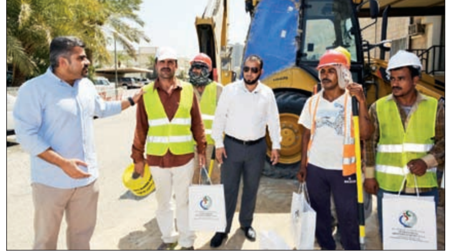
توزيع المبردات على العاملين